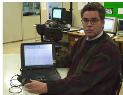
Figura 3 – Cardiologista remoto e a interpretação do ECG digital enviado.