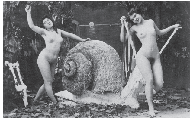
Figura 3 – Mulheres nuas posam ao lado de um falso caracol gigante.

Mesmo a fotografia erótica nascente não se furtava em estabelecer a relação ambígua entre o humano e o natural. Como no caso da figura 3, um anônimo de 1905, em que duas mulheres nuas posam ao lado de um falso caracol gigante no quadro de um igualmente falso cenário de lago.