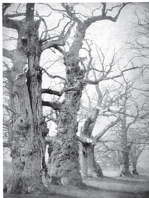
Figura 1 – Leafless nature oak trees.

A expansão do uso do calotype permitiu a muitos artistas apreender aspectos da paisagem – e assim desenvolver um pensamento fotográfico específico sobre a natureza, na medida em que extrapolavam as condições da pintura e do desenho. Nesse contexto, uma das mais impressionantes coleções de imagens do século XIX é a produzida por David Octavius Hill e Robert Adamson entre 1843 e 1847, atualmente preservadas na Glasgow University Library. Leafless nature oak trees (Figura 1), de David Octavius Hill, faz parte da coleção.