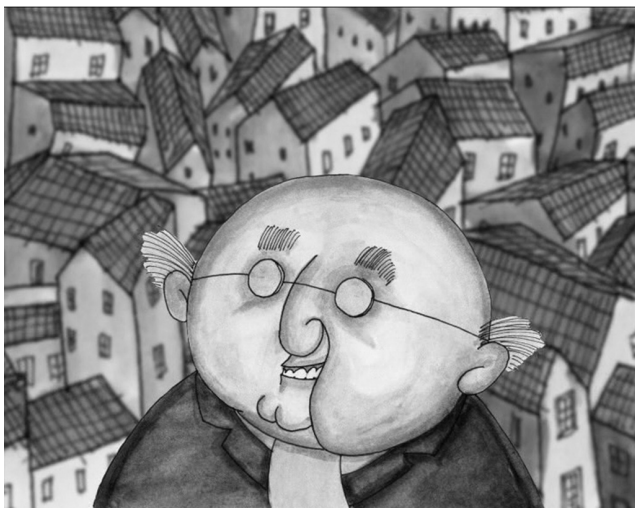
Fig. 9: O Sr. Raposo está feliz com a sua dentadura nova

Obtido o objecto de desejo, a história termina com o Sr. Raposo a regressar às suas rotinas, mas mais feliz por ter resolvido o seu problema. Regressa ao banco do jardim para, na companhia dos pombos seus amigos, poder, enfim, mastigar e engolir as tão desejadas bolachas (Fig. 10).