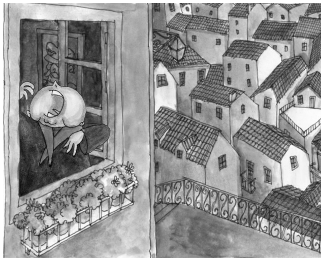
Fig. 7: Cedendo aos elogios, a senhora canta alto

pedindo-lhe para cantar mais e mais alto. Tomada de brio e vaidade, a velhota canta mais alto e tanto e tão mais alto que, boca aberta, inadvertidamente deixa cair a dentadura da janela abaixo (Fig. 7).