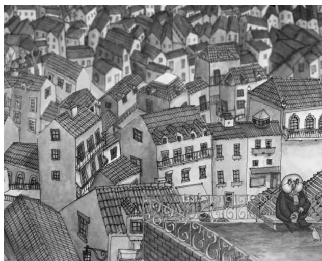
Fig. 2: O Sr. Raposo dá comida aos pombos

A narrativa visual trata fundamentalmente de ações. Como tal, os processos usados são predominantemente materiais (verbos de fazer) e comportamentais (verbos de comportamento) para mostrar o que está a acontecer ( vide quadro 1). Halliday (1994) através da categoria da transitividade, na qual o falante manifesta a sua experiência do mundo (metafunção ideacional da linguagem), classifica os tipos de processos em materiais, mentais, verbais, relacionais, comportamentais e existenciais. O estudo da transitividade permite-nos, através da oração (unidade básica de análise da léxico-gramática), analisar a representação de quem faz o quê, a quem, e as respectivas circunstâncias.