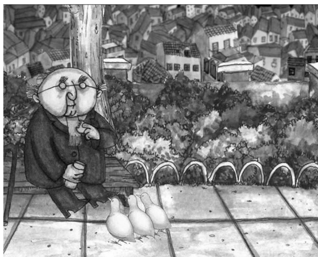
Fig. 10: O Sr. Raposo regressa à sua rotina, feliz, porque já tem dentes para mastigar

na e sequencial a fim de percebermos que tudo o que vimos não passou de um episódio na vida (rotineira) do Sr. Raposo.