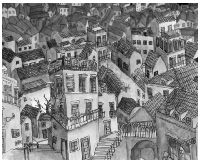
Fig. 1: Bairro típico de Lisboa antiga

A primeira parte da animação é dedicada à orientação. Esta é constituída pelo cenário (setting) de um bairro típico, que poderá ser Lisboa antiga (Fig. 1), com as suas casas encavalitadas umas nas outras, ruas estreitas, escadarias, praças, miradouros e uma população envelhecida, onde os homens têm como ponto de encontro as praças ou pequenos jardins para jogarem às cartas e, as mulheres, de forma mais individualizada, se dedicam às tarefas domésticas, de portas e janelas bem abertas. Tanto homens como mulheres coabitam com gatos e pombos nestes bairros populares, que vão alimentando ao sabor da sua solidão compassiva.