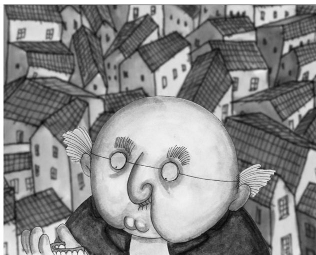
Fig. 8: O Sr. Raposo apanha a dentadura

Nesse momento, o Sr. Raposo vê a oportunidade que não pode perder: apodera-se da dentadura da mulher e coloca-a na sua própria boca (Fig. 8).