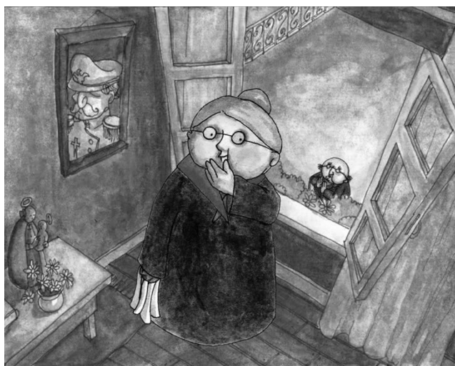
Fig. 6: O Sr. Raposo lisonjeia a autora da cantoria

O Sr. Raposo aproxima-se, ouve a canção que a senhora canta e aplaude (Fig. 6).