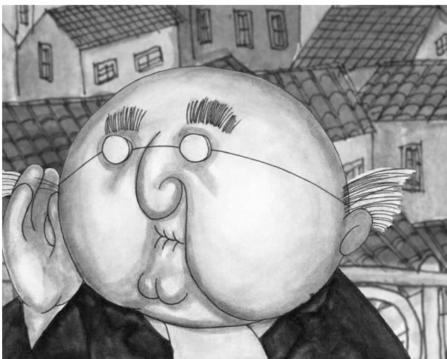
Fig. 4: O Sr. Raposo ouve alguém cantar

Um dia, o Sr. Raposo é arrancado da tristeza em que está mergulhado (fruto da sua desconsolada condição de desdentado) pelo cantarolar de uma voz feminina (Fig. 4).