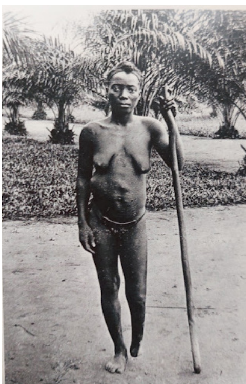
Figura 6 – Autoria desconhecida. Escritos originais. Mulher com pé amputado, mutilada por sentinelas, 1905

Como exemplo das primeiras manifestações fotográficas que marcou a violência contra africanos, Sealy (2019) utiliza os arquivos fotográficos em que nativos do Congo foram submetidos à escravidão e a humilhações de toda sorte por conta da ordem colonizadora comandada por Leopoldo II, rei da Bélgica que liderou o imperialismo naquele país africano entre os anos de 1885 a 1908. No caso do Congo, os nativos foram registrados com corpos mutilados deliberadamente. De acordo com as regras do país imperialista, os sujeitos que infringissem os códigos de conduta teriam alguma parte do corpo (mão, dedos, pés, braços) extirpada e, como modo de confirmar o cumprimento da medida, a pessoa punida seria fotografada e a imagem seria enviada às autoridades belgas como modo de anuência das punições realizadas.