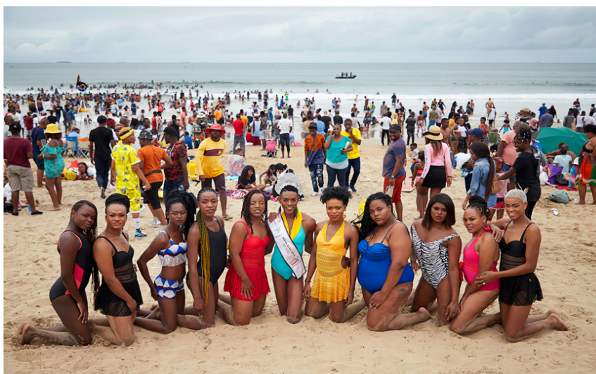
Figura 4 – Bravas belezas, Durban, África do Sul, 2020

A decolonialidade das produções de Muholi subverte a ordem estigmatizante e procura oferecer outros sentidos aos desejos de mulheres negras lésbicas. Aliás, a atenção de Muholi contempla também outros sujeitos da comunidade LGBTQIA+ em momentos que não sejam de sofrimento, vulnerabilidade ou sub-representação.