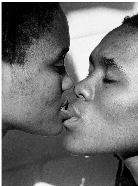
Figura 3 – Beijo, Joanesburgo, África do Sul, 2003

As fêmeas excluídas por e nessa descrição não eram apenas subordinadas, elas também eram vistas e tratadas como animais, em um sentido mais profundo que o da identificação das mulheres brancas com a natureza, as crianças e os animais pequenos. As fêmeas não brancas eram consideradas animais no sentido de seres "sem gênero", marcadas sexualmente como fêmeas, mas sem as características da feminilidade. As fêmeas racializadas com seres inferiores foram transformadas de animais a diferentes versões de mulher [...]. Portanto, a violação heterossexual das relações de gênero entre os colonizados – quando isso foi conivente e favorável ao capitalismo eurocêntrico global e à dominação heterossexual das mulheres brancas.