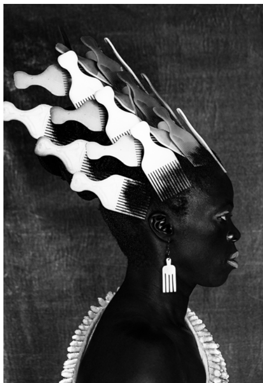
Figura 5 – Zanele Muholi, Qiniso, The Sails, Durban, África do Sul, 2019

As imagens produzidas por Muholi podem ser demonstrações da comunicação ex-cêntrica ao trazer à tona representações que, muitas vezes, deliberadamente, são esquecidas. Ao agir fora do "centro", a fotógrafa promove a visibilidade e representatividade de culturas e subjetividades que se encontram marginalizadas, além de trazer a ancestralidade como modo poético de criação fotográfica.