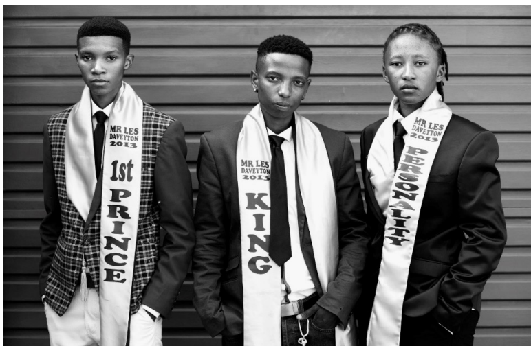
Figura 1 – Vencedoras do Mister Lésbica de Daveyton, Joanesburgo, África do Sul, 2013. Autora: Zanele Muholi, cortesia Yancey Richardson Gallery, Nova York

Lésbica, quando estava em evidência a proposta sobre lesbianidades masculinizadas (Figura 1).