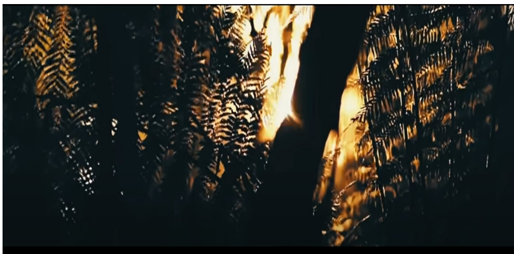
Figura 3 – Imagem do videoclipe Proteção – cena destacando a natureza

6