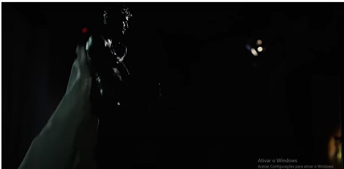
Figura 6 – Imagem videoclipe Perfeita Contradição – foco em escultura não religiosa