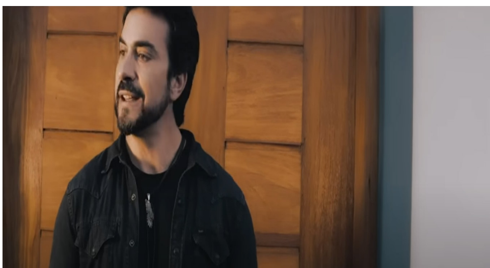
Figura 2 – Imagem do videoclipe Proteção – cena inicial com detalhe da porta

5