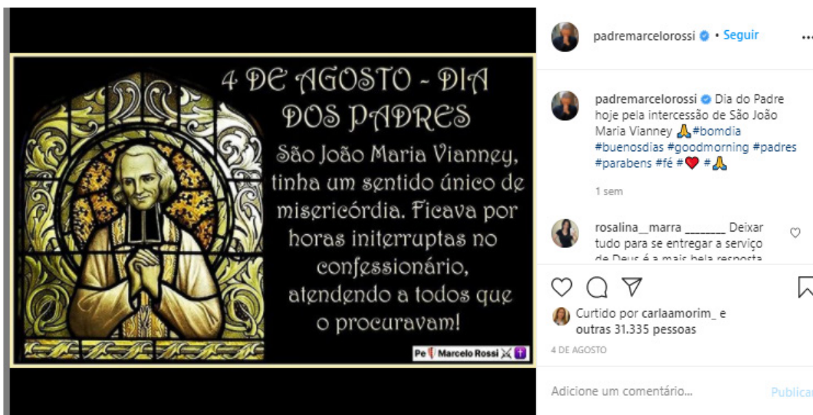
Figura 11 – Imagem do Instagram – Pe. Manzotti destaca o patrono dos padres em sua postagem