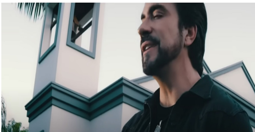
Figura 1 – Imagem do videoclipe Proteção – cena inicial com detalhe da fachada

4