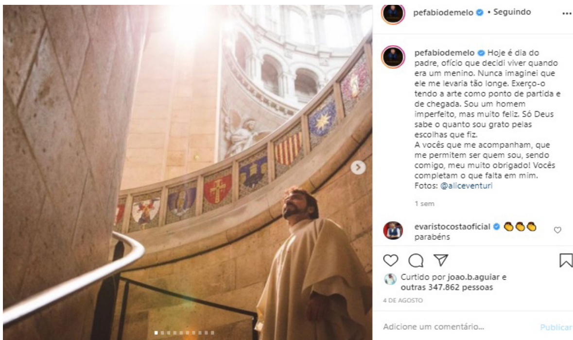
Figura 13 – Imagem do Instagram – Pe. Fábio posta foto sua com texto autoral sem menção ao patrono dos padres

18