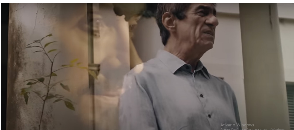
Figura 8 – Imagem do videoclipe Perfeita Contradição – cena cantor Fagner no espaço externo

No videoclipe em questão, Raimundo Fagner e Fábio de Melo estão situados em locais diferentes. Não há interação física entre eles: coabitar o mesmo espaço foi considerado menos importante. Enquanto o padre encontra-se no lugar fechado que já descrevemos, Fagner canta em lugar aberto, na entrada de um casarão que poderia ser o próprio espaço no qual Fábio de Melo realizou sua apresentação (Figura 8 e 9).