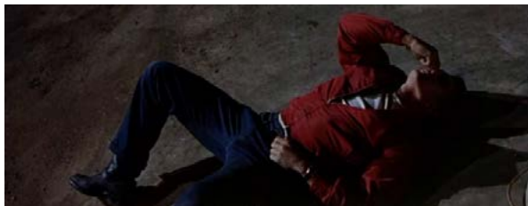
Figuras 8 e 9 – As cores vermelha, azul e branca