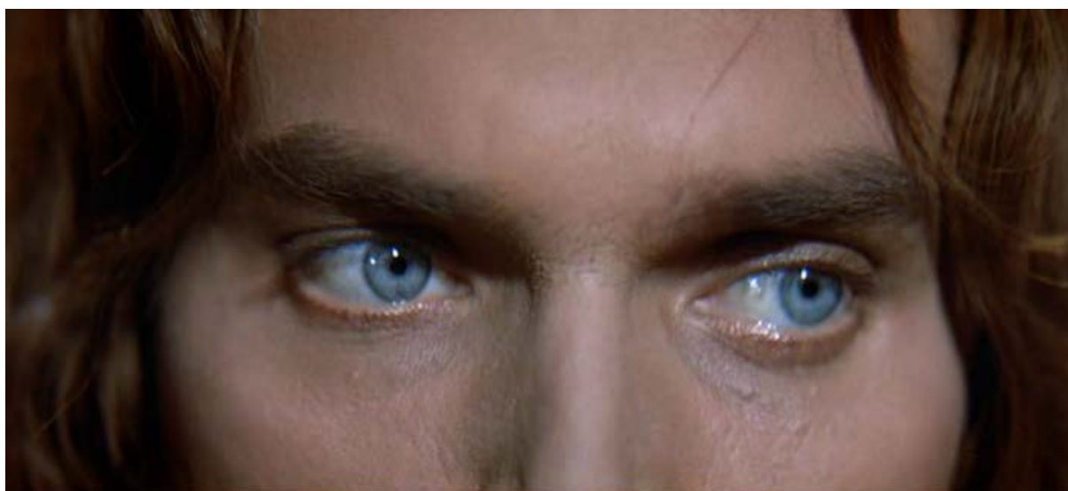
Figura 4 – O rosto de Cristo (b)