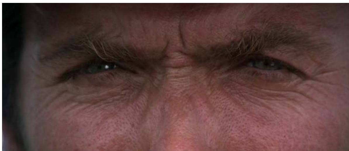
Figura 6 – O super close de Clint Eastwood