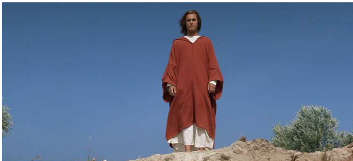
Figura 7 – As cores vermelha, azul e branca