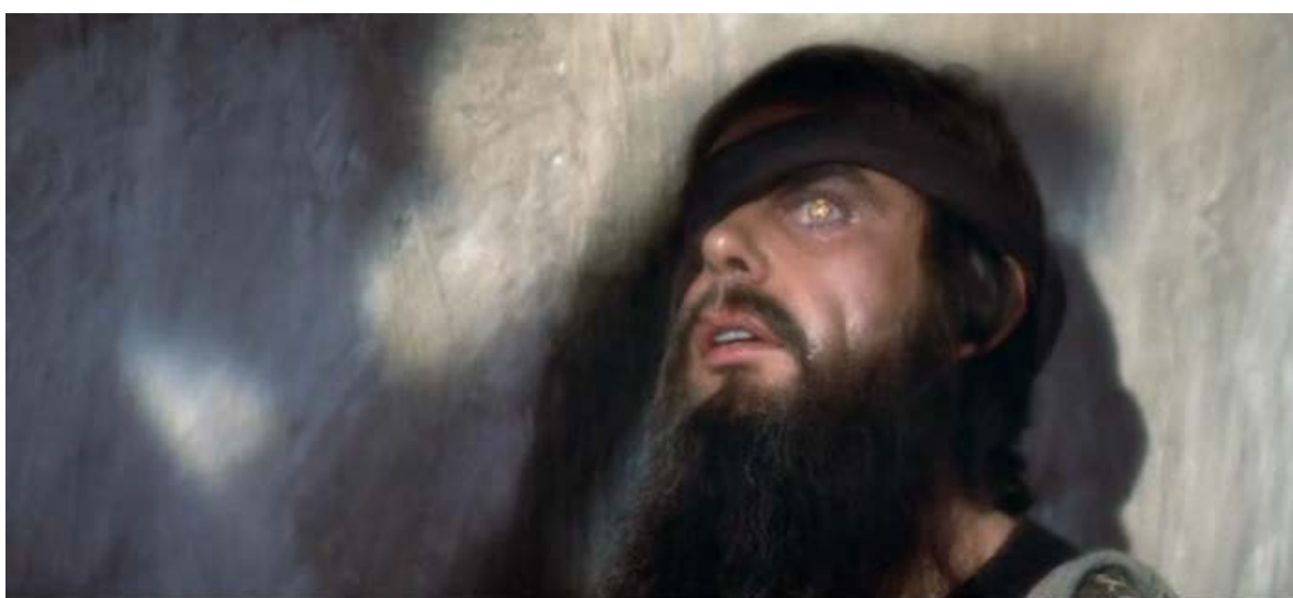
Figura 3 – O rosto de Cristo (a)