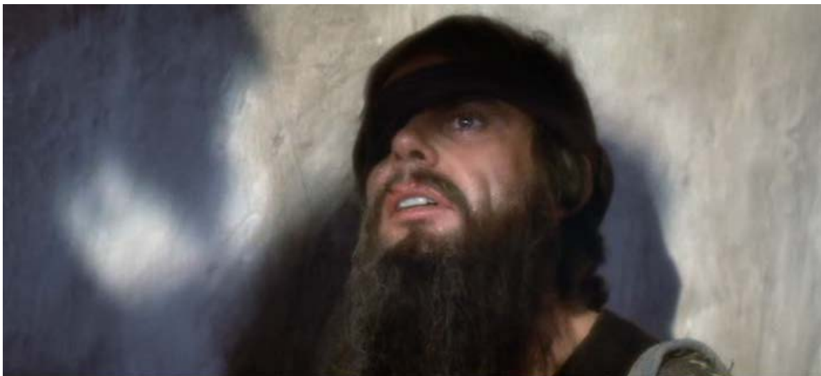
Figura 4 – O rosto de Cristo (c)