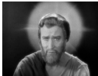
Figura 2 – O ícone de Cristo