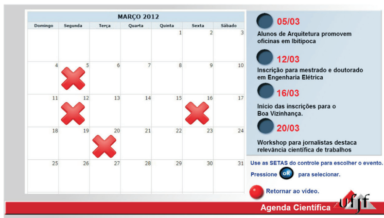
Figura 6 – Interface da agenda eletrônica do programa-piloto.

apresenta eventos fictícios e não está on-line. Esse aplicativo pode ser um aliado também na difusão de programas de extensão, como os projetos de caminhadas que acontecem na UFJF. Na verdade, o usuário poderia não só ter acesso à agenda, como também fazer a sua inscrição no evento desejado através do canal de retorno.