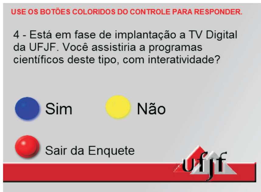
Figura 9 – Enquete aplicada durante o programa-piloto.

a distância, seria possível disponibilizar o link Mão na Massa , com dicas e tarefas para os usuários/estudantes colocarem em prática o conteúdo do programa.