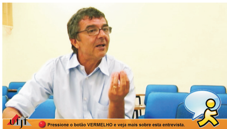
Figura 4 – Interface de acesso a vídeo anexo.

Os links para os vídeos anexos do programa anterior não vinham com a informação indicando como acessar; apenas aparecia o botão e uma informação sobre o conteúdo a ser acessado. Para quem se depara pela primeira vez com esta tecnologia, pode ser difícil entender o que se deve fazer diante dessa possibilidade. Por isso, neste programa, optou-se por já indicar, junto à imagem do botão vermelho, como o usuário deve se portar. Outra observação é que, neste programa, os vídeos anexos têm um botão de “saída” para o usuário retornar ao vídeo principal, caso queira. Este é mais um diferencial em relação ao programa anterior, uma vez que, quando o usuário acessava os vídeos anexos, tinha de aguardar a finalização destes para retornar ao roteiro linear. Durante o programa, ainda há mais duas opções de vídeos anexos. Um é sobre o Cineduca , uma atividade do projeto que apenas é citada em um momento do vídeo principal, e, por isso, abrimos este espaço para quem quiser entender esta dinâmica. O outro vídeo é sobre Letramento Digital , que é uma das bases desta