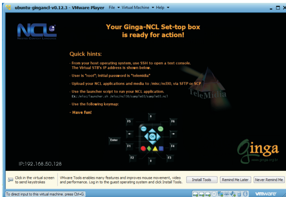
Figura 1 – Tela inicial do VMWARE Player indica as teclas do computador que correspondem aos botões do controle remoto da TV que são usados para interagir.