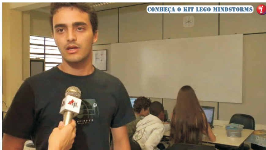
Figura 2 – No canto superior da tela, link de acesso para vídeo anexo.

Para exibir a possibilidade de acesso aos vídeos anexos, apenas foi inserido na tela, no canto direito superior, um botão na cor vermelha com a letra “i” no centro, simbolizando a interatividade disponível, conforme a Figura 2.