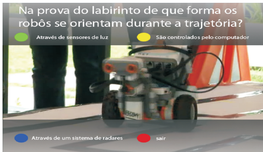
Figura 3 – Quiz aplicado durante o programa-piloto.

No caso específico deste trabalho, o aplicativo de quiz teve como objetivo trazer ao usuário informações adicionais e complementares. As respostas dos quizzes não estavam diluídas ao longo do programa. Não bastava apenas prestar atenção e decorar informações. As perguntas foram elaboradas para fazer o usuário responder, usando, para isso, o raciocínio lógico. Não que as perguntas fossem bastante óbvias; elas não eram. Por exemplo, a primeira questão, que está dentro do vídeo anexo sobre o Kit Lego, traz curiosidades sobre a programação dos robôs construídos com base no Kit. A pergunta é a seguinte: “Qual destes sensores o Kit Lego Mindstorms não possui?”. Por meio da resposta, o usuário aprende algumas funcionalidades dos robôs. Outro quiz aparece durante um clip de imagens que evidencia a prova do Labirinto 8 : “Na prova do Labirinto, de que forma os robôs se orientam durante a trajetória?”. Com a resposta, o usuário recebe mais uma informação adicional sobre os sensores que facilitam a missão do robô de percorrer o trajeto.