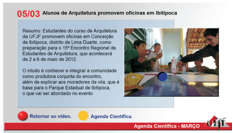
Figura 7 – Depois de selecionar um evento, o usuário tem acesso à sua sinopse.