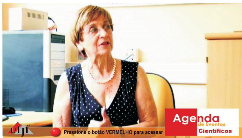
Figura 5 – Link de acesso ao aplicativo de agenda eletrônica.

O quarto aplicativo interativo que aparece no programa é uma agenda eletrônica, como pode ser visto no link de acesso ilustrado na Figura 5.