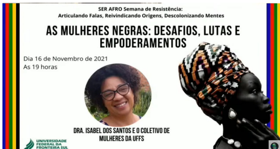
Figura 3 – Coletivo de Mulheres Negras da UFFS

e ações pautadas na educação para as relações étnico-raciais e o combate ao racismo, que dão materialidade à Lei nº 10.639 (Brasil, 2003).