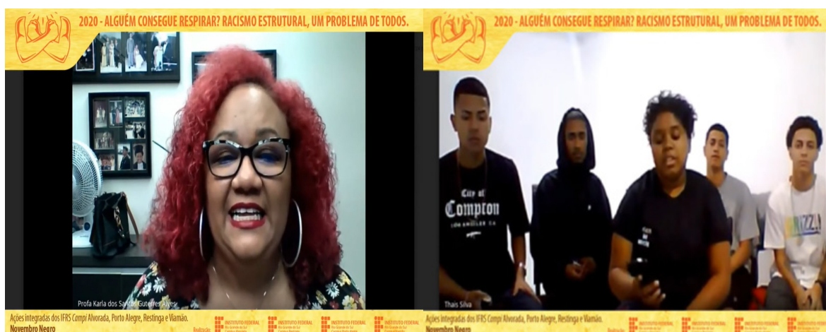
Figuras 5 e 6 – “Alguém consegue respirar? Racismo estrutural, um problema de todos”

identifica-se um conjunto de ações integradas do Novembro Negro , como a série iniciada em 2020, tendo continuidade em 2021, nomeada “Alguém consegue respirar? Racismo estrutural, um problema de todos”, como parte de Ação Integrada dos IFRS Porto Alegre, Viamão e Restinga, Ação Integrada entre o IFRS e a UFFS campus Erechim, Ação Integrada entre IFRS e escolas da Rede Municipal de Ensino de Canoas, Ação Integrada entre o IFRS Rio Grande e a Prefeitura de Rio Grande e Ação Integrada entre Campus Rolante e Campus Osório, o que, de certo modo, impacta o cotidiano das práticas dos IFs.