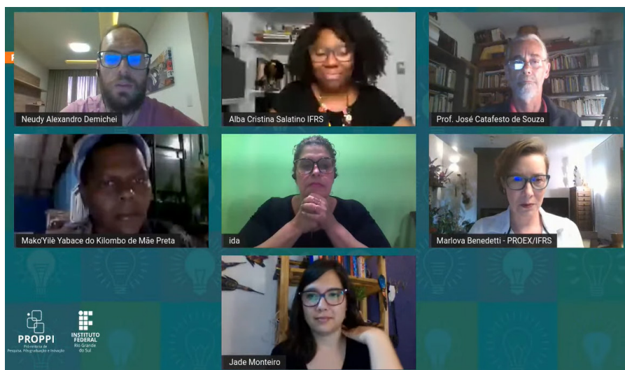
Figura 2 – NEABI, Núcleos de Ações Afirmativas (NAAfs)/IFRS