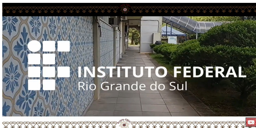
Figura 4 – Capa do documentário “Sankofa: Ancestralidade guia meus ensinamentos”