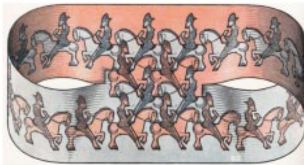
Figura 3. Escher: Horseman

É possível que, ao fixar o olhar na obra de Escher que abaixo transcrevo, o espectador, num primeiro contato com as imagens, capte tão somente um tipo de composição em que a ilusão de um movimento circulatório das figuras e a sua imobilidade se confundam. Mas também é possível que esse mesmo espectador, levado pelo desejo de compreender melhor as configurações que aí se combinam, vislumbre, no interior das abstrações que elas lhe transmitem, um jogo de compartimentos, de marcas feitas no caminho percorrido pelos cavaleiros e, de repente, “escute” as ressonâncias do silêncio e se convença de que sua surdez ideológica engendra, como sem querer, que o sentido é infinito e que o cosmos exterior das esferas semânticas é, no fundo, esse lugar nenhum de que dependem as lacônicas mensagens dos textos visuais e a imperfeição que se arraiga em qualquer tentativa de comunicação .