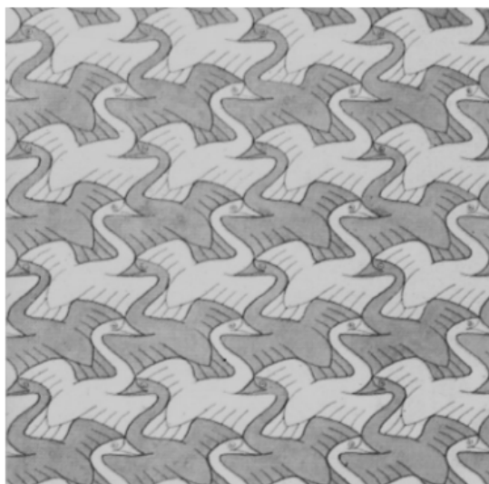
Figura 1. Escher: Symmetry Work

titui uma espécie de coisa nenhuma e que para muitos estudiosos da linguagem teria, por anteceder à formação das línguas, uma insignificância digna de ser desprezada. Mas, pensado substancialmente, o continuum do silêncio, inserido nos pressupostos da teoria de Hjelmslev, assume uma admirável relevância: é um quase nada que tem a extraordinária função de estar na raiz da constituição das formas significantes, das unidades expressivas em que a fala humana se harmoniza com os limitados alcances da respiração e, conseqüentemente, com a precária escala das gradações tensivas da voz, motivos que, inevitavelmente, recaem sobre as formas do conteúdo e produzem relativizações semânticas extremamente sutis.