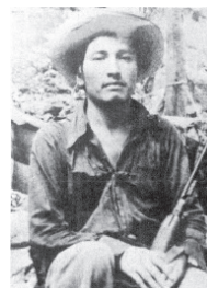
Figura 9 – Lucio Cabañas