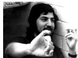
Figuras 11 e 12 – Guillén Vicente como subcomandante Marcos