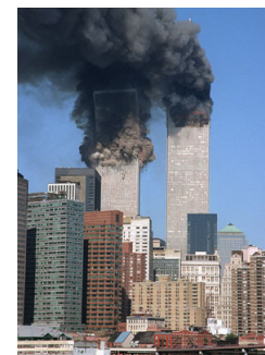
Figura 6 – Ataque da Al-Qaeda em 2001.

Segundo Lind et al. (1989), a Quarta Geração se refere ao uso intensivo da propaganda, doutrinação, terror e segredo. Os insurgentes buscam vencer a superioridade militar do opositor abalando sua reputação, desafiando-o e humilhando-o. Muitos desses insurgentes atuam globalmente. Sua vitória moral é obtida provocando divisões internas na opinião pública inimiga, ameaçando-a constantemente e disseminando a incerteza e a desconfiança sobre seu futuro econômico. Ou seja, o alvo dos grupos rebeldes é toda a sociedade inimiga, e não somente suas forças armadas. Não há nestes casos uma distinção clara entre o front interno e o campo de batalha. Desaparece igualmente a distinção entre civis e militares. São operações psicológicas e a luta torna-se uma guerra de nervos. Informação em vez de mísseis é a arma principal destes grupos que visam atormentar em vez de destruir o inimigo. Para tanto, lhes parece mais relevante ocupar alguns minutos dos telejornais do que matar soldados. Este tipo de ação equivale ao conceito anarquista de “ação direta” e de “propaganda pelos