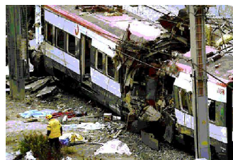
Figura 5 – Bomba destruiu um trem em Madri em 2004.