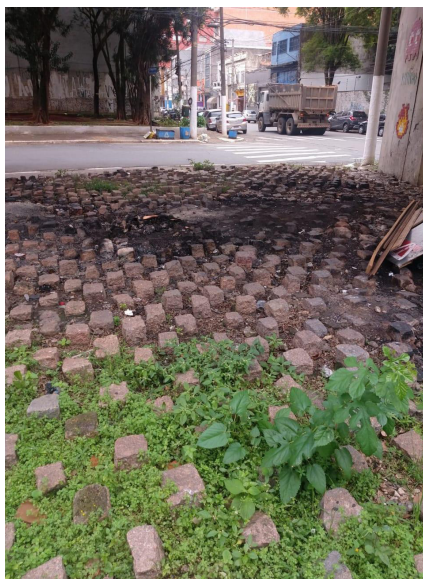
Figura 1 – “Nem tão plano para dormir”, Elevada/São Paulo (SP)

temporal. Tal ocorrido nos desperta a refletir o quanto os demais cidadãos passaram alheios a essa instalação, ou seja, houve a sedimentação da “naturalização e do expurgo do outro” (RESENDE, 2012, p. 447).