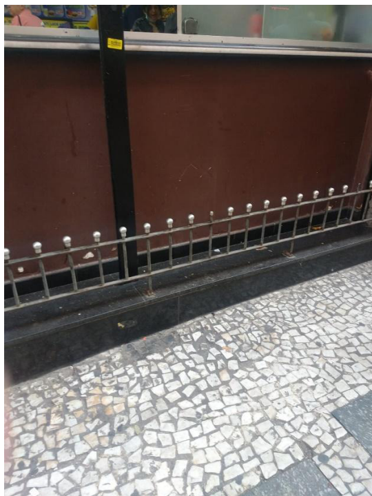
Figura 4 – “Não pare aqui!” – Janelas de um restaurante, Porto Alegre (RS)