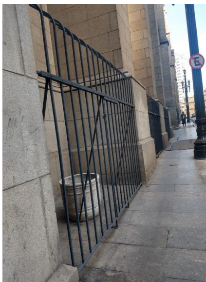
Figura 7 – “Nem as flores resistiram”, Igreja da Sé/São Paulo (SP)

que inviabilizam que uma pessoa ou animal permaneça naquele local, atuando como uma intervenção de limpeza urbana e desconsiderando o direito de todos à cidade.