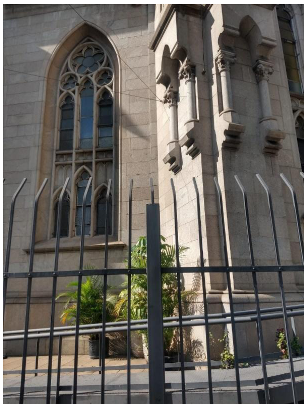
Figura 5 – “Tão longe, mas tão perto”, Igreja da Sé/São Paulo (SP)

Ao relacionar com o foco da nossa pesquisa, que é apreender a dimensão simbólica, conseguimos compreender a força e o poder exercido sobre nossos corpos e nossas visões por meio de uma rotina naturalizada. Os espaços que podemos ou não ocupar e as marcações que são colocadas sob uma falsa vigilância pela segurança, como ilustra a Figura 5. Ou, de forma mais direta, como apresenta a Figura 6, em que um pequeno espaço é preenchido com ferros para que nenhum ser vivo se acomode naquele local.