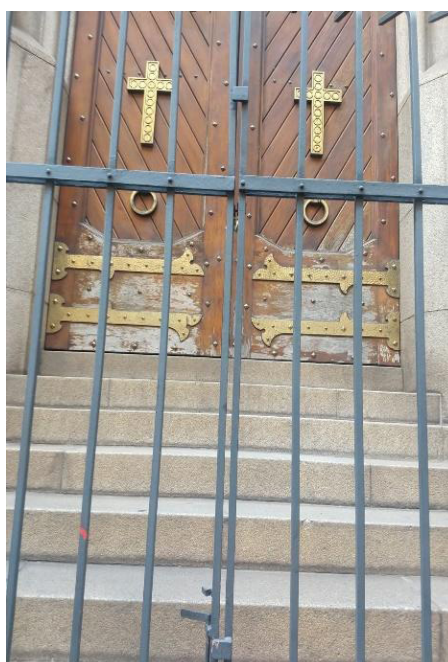
Figura 3 – "Acesso negado" à Igreja da Sé, São Paulo (SP)

Nesse mote, a violência da sociedade contemporânea, a cultura do medo e a criminalização da pobreza, estabeleceram uma série de mudanças nas ações das pessoas e, também, na arquitetura das cidades. Grades, pontas de flechas, cadeados, monitoramentos, horários rigorosos, entre outros, fazem da nossa vida uma constante espera pelo inimigo. Mesmo em templos religiosos podemos perceber que não estamos tão seguros dos perigos mundanos. Na Figura 3 observamos que, além das portas fechadas, ainda temos grades nos separando da bênção sagrada.