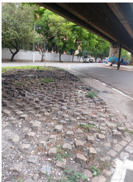
Figura 2 – “Pedras... muitas pedras”, Viaduto/São Paulo (SP)