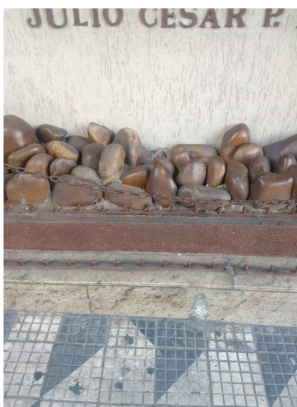
Figura 8 – “Durma bem!?” , Monumento/São Paulo (SP)