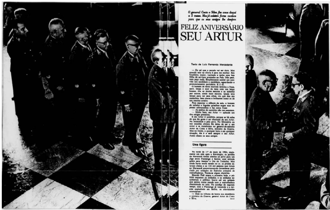
Figura 1 – Feliz Aniversário Seu Artur

Fonte: MERCADANTE, Luiz Fernando. Feliz Aniversário Seu Artur. Realidade, São Paulo: Ed. Abril, ano I, n. 2, p. 24-29, maio de 1966.