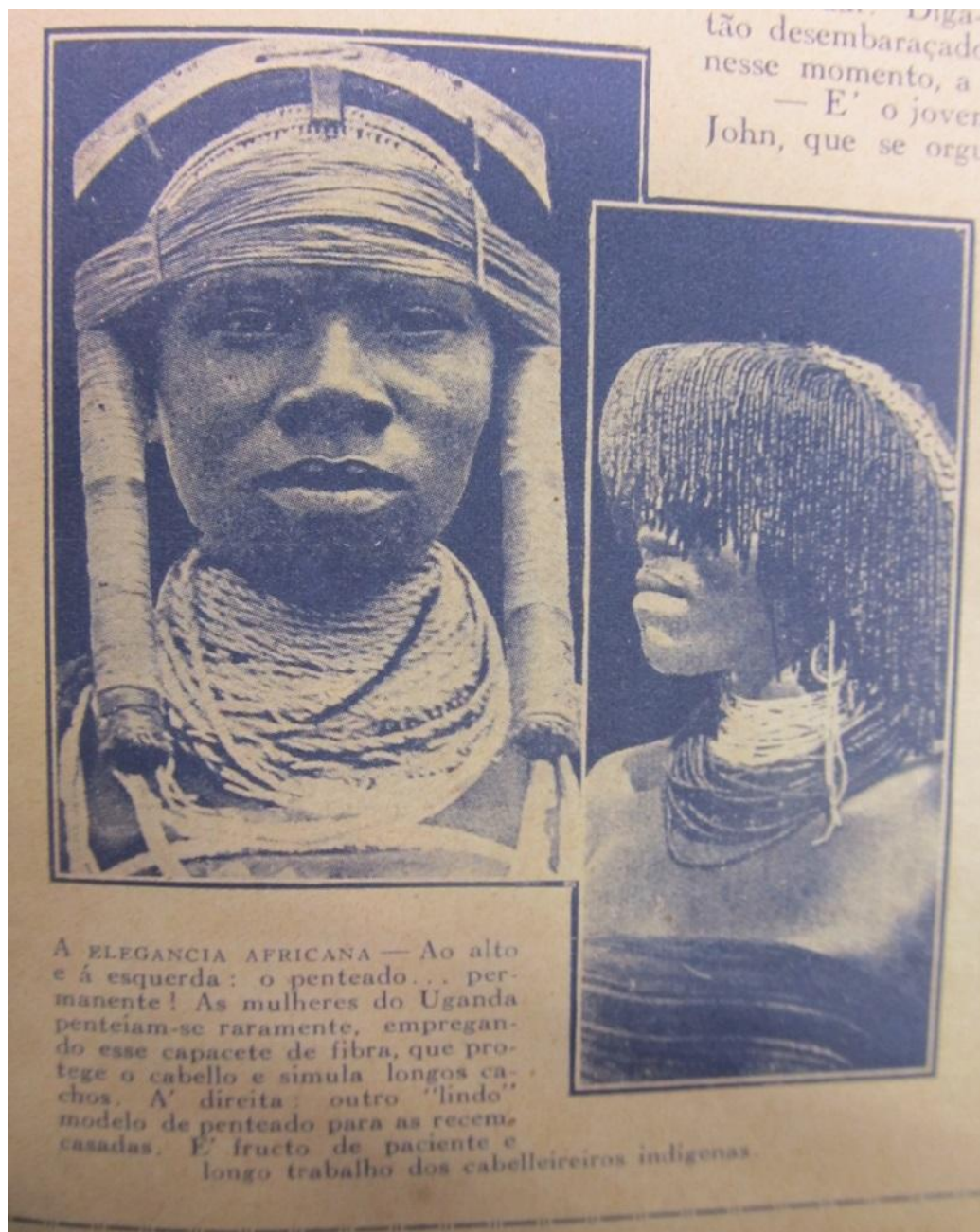
Figura 3 -“A elegância Africana – Ao alto e à esquerda: o penteado... permanente! As mulheres do Uganda penteiam-se raramente, empregando esse capacete de fibra, que protege o cabelo e simula longos cachos. Á direita: outro ‘lindo’ modelo de penteado para as recém-casadas. É fructo de paciente e longo trabalho dos cabeleireiros indígenas”.

Na legenda da figura acima, a palavra “lindos”, entre aspas, corrobora um olhar de estranhamento sobre os cabelos e penteados das mulheres africanas, o que exemplifica a visão estereotipada e preconceituosa dos europeus sobre outras culturas. Deste modo, é possível verificar uma certa ironia por parte da revista Eu Sei Tudo ao usar este adjetivo entre aspas conferindo uma conotação negativa à beleza e hábitos das mulheres africanas.