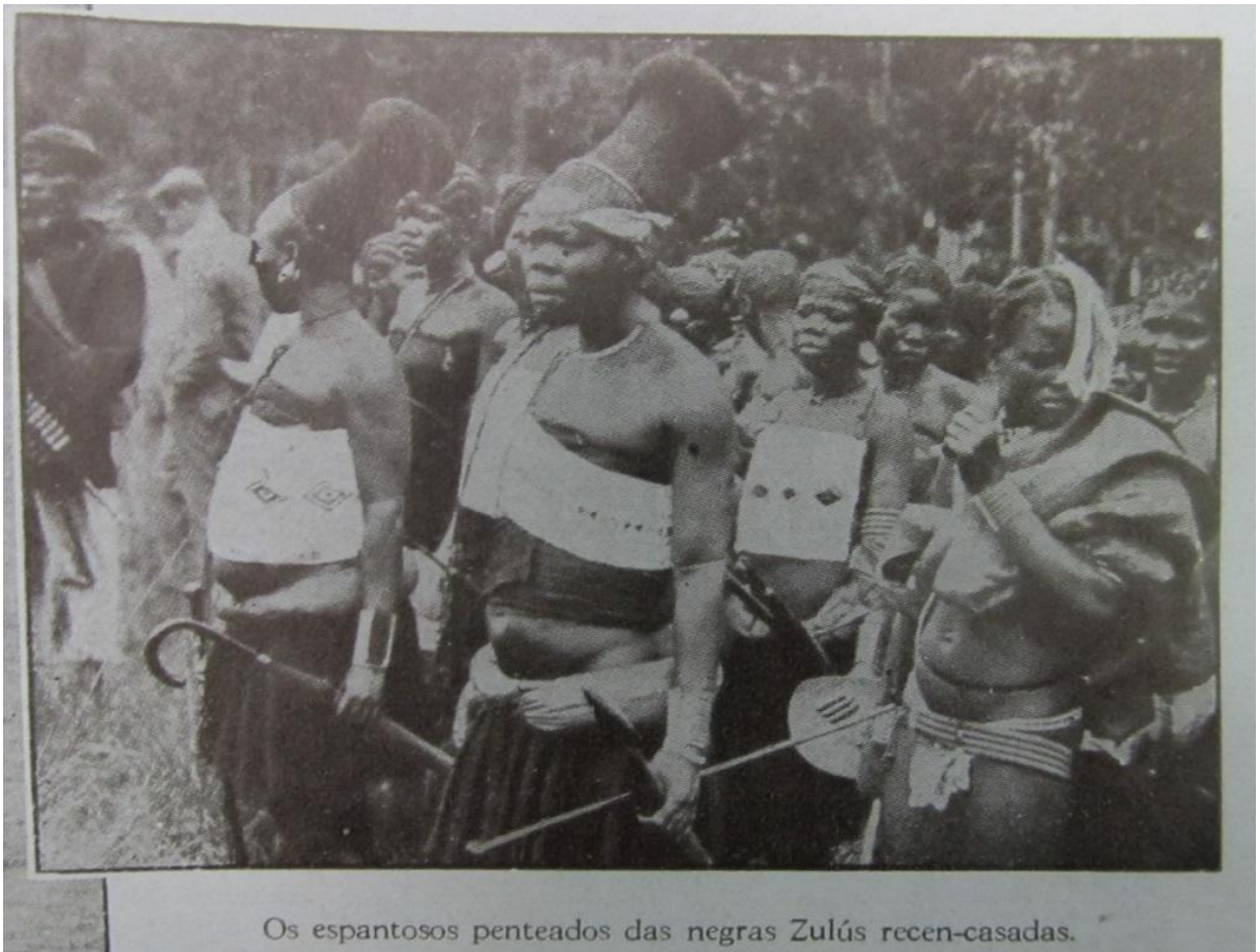
Figura 2 - “ Os espantosos penteados das negras Zulús recém-casadas. ”

Quase sempre as legendas que acompanham as imagens demonstram a forma como a revista Eu Sei Tudo se dirigia à cultura e mulheres da África, isso porque estão impregnadas da visão eurocêntrica que estabelecia as mulheres europeias como padrão de beleza. As adjetivações utilizadas pela revista no trato dos cabelos das mulheres africanas sinalizam para a visão veiculada em suas páginas, geralmente vinculada à ideia do “pitoresco”.