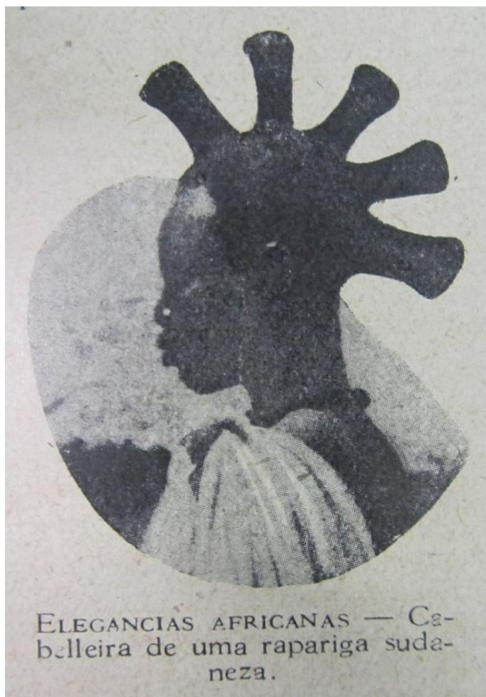
Figura 1 - “Elegancias Africanas – Cabelleira de uma rapariga sudanesa.”.

Este artigo tem como objetivo tratar da construção de representações acerca das mulheres africanas através dos cabelos femininos africanos contrapostos, em imagens e textos da revista Eu Sei Tudo , aos padrões de beleza europeus e discute, ainda, o imaginário social que tais representações alimentavam. Esse magazine foi uma versão nacional de uma publicação homônima, a Je Sais Tout , que circulou na França entre 1905 e 1939; no Brasil, foi editada entre junho de 1917 e dezembro de 1958. No período aqui recortado para análise, entre 1917 e 1929, ainda era forte a presença de um ideário francófono de civilização, modernidade 1 e cultura entre nós. Além disso, em sua versão brasileira, de forma integral ou