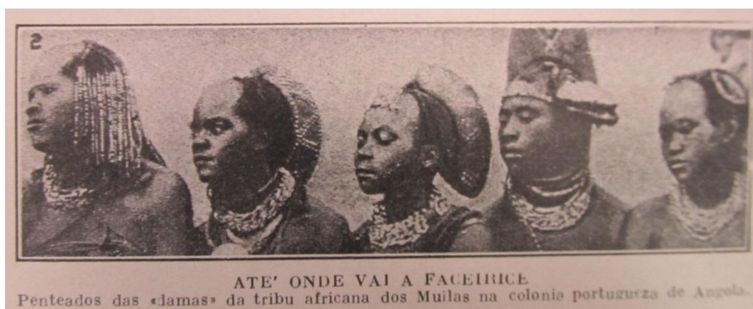
Figura 5-“Até onde vai a faceirice – Penteados das damas da tribo africana dos Muilas na colônias portuguesa de Angola”.

As imagens e suas legendas reforçam supostas dicotomias entre a cultura africana e o padrão moderno, urbano e europeu de cuidado de si. Quando postas em comparação com