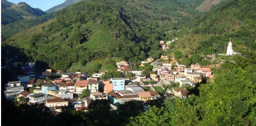
Figura 1 – Vista panorâmica do centro de Santa Leopoldina – perímetro urbano