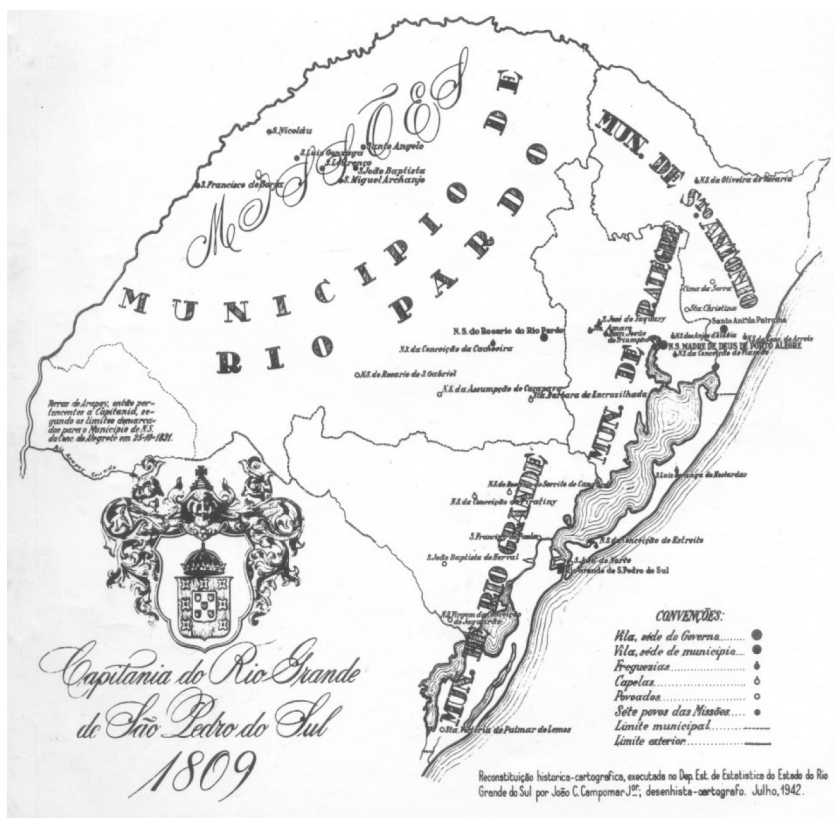
Figura 2. Mapa da Capitania do Rio Grande de São Pedro do Sul em 1809 (Fonte: FUNDAÇÃO DE ECONOMIA E ESTATÍSTICA. De Província de São Pedro a Estado do Rio Grande do Sul: censos do RS (1803-1950) . Porto Alegre, 1986. v. 1. p. 46).