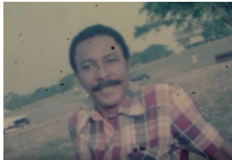
Trecho do documentário Os Dias com Ele