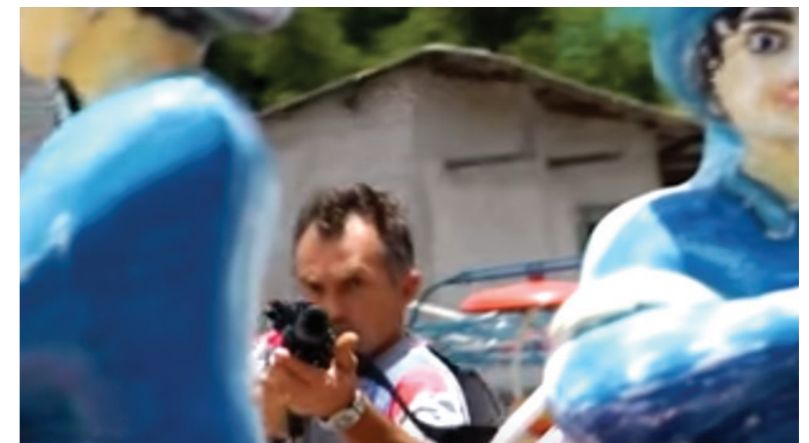
Trecho do documentário Jesus no Mundo Maravilha