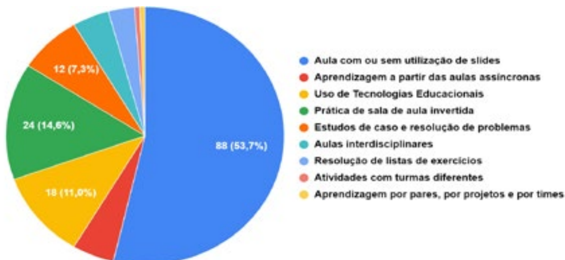
Gráfico 1 – Estratégias utilizadas durante as aulas