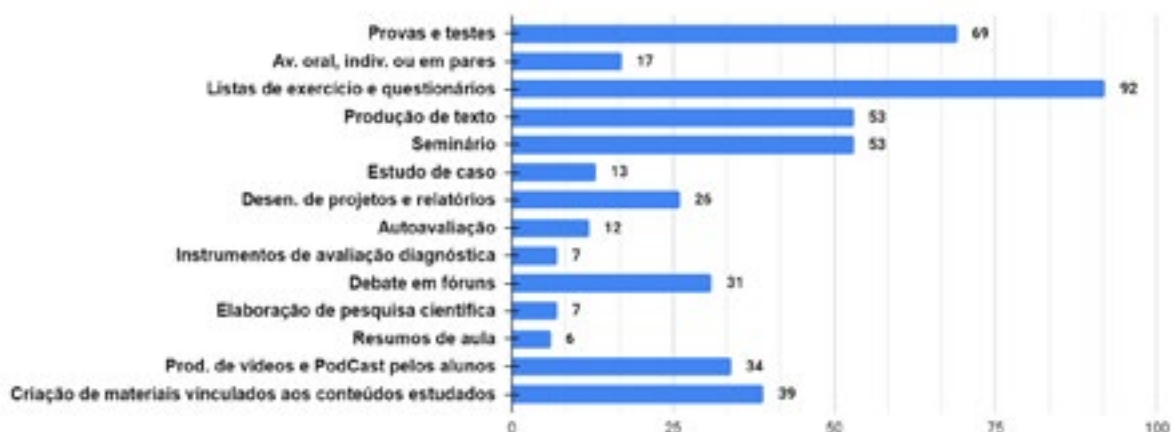
Gráfico 2 – Atividades para avaliação da aprendizagem