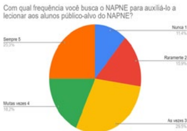
Gráfico 3 – Frequência com a qual os docentes buscam apoio no NAPNE para auxiliar a lecionar aos alunos com deficiência

Quando perguntados sobre a busca por auxílio para confeccionar o PEI, os docentes recorrem ao NAPNE (85,7%), setor pedagógico (64,3%), livros e artigos da área (21,4%) e não buscam ninguém (3,6%). Vale ressaltar, também, que a maioria dos docentes disse buscar o NAPNE com frequência intermediária e sempre, em uma escala de 1 a 5, em que "1" é "raramente" e "5" é "sempre", para auxiliá-lo a lecionar aos alunos, conforme Gráfico 3.