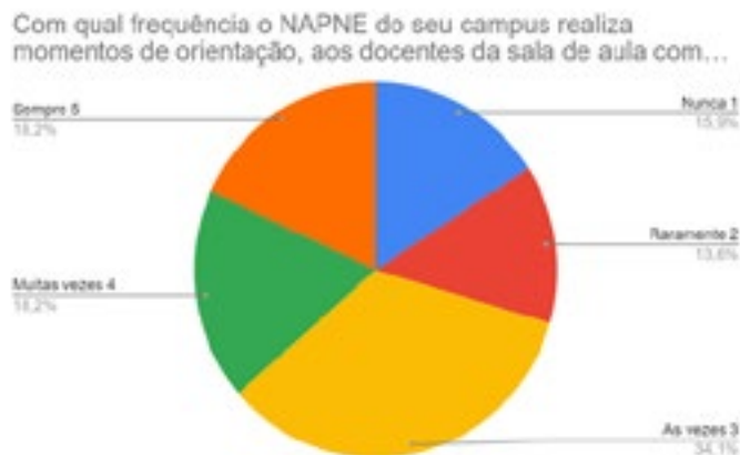
Gráfico 1 – Frequência com a qual o NAPNE realiza momentos de orientação ao docente da sala de aula comum