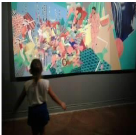
Foto 1. Exposição Meu país tropical