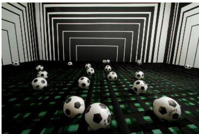
Imagem 5. Olé , de Maruzza Valdetaro (2013)

A presença da criança no local, pelo reconhecimento de ídolos ou pelo simples fato de encontrar-se com o que lhe parecia familiar, possibilitou também maior intimidade com o espaço museológico. Contudo, percebe-se que essa experiência foi ampliada e redimensionada no momento seguinte, quando a instalação propunha interação com o espectador. Assim, na sequência da visita, as crianças foram conduzidas à sala que abrigava a instalação Olé , de Maruzza Valdetaro (2013) ( Imagem 5 ). Esse momento favoreceu maior interação das crianças com o espaço, visto que no local elas eram convidadas a interagir com a obra. A pesquisadora descreve o espaço e a dinâmica proposta.