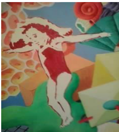
Foto 2. Detalhe da obra na exposição Meu país tropical