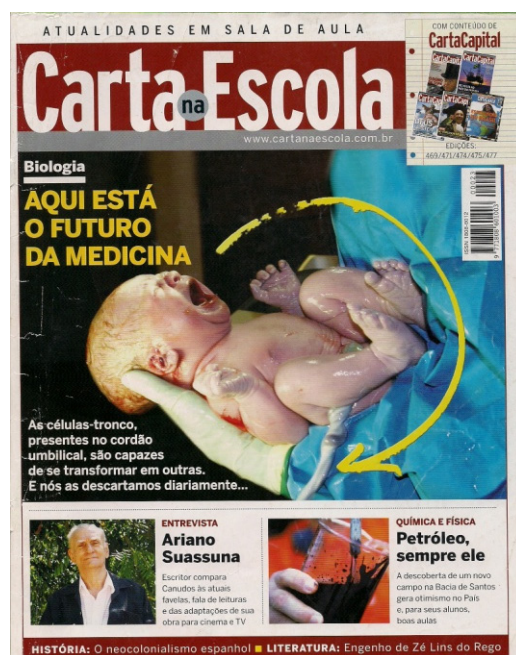
Figura 1 – Carta na Escola , n. 23, capa.

Para situar a questão das inovações nas tramas do neoliberalismo americano, apresentaremos uma discussão inicial com os escritos de Theodore Schultz, um dos expoentes da conhecida Escola de Chicago e um dos principais responsáveis teóricos pela teoria do Capital Humano. Iniciamos essa seção, partindo do conceito de investimento, situando-o junto ao comprometimento em aquisição de rendas futuras ou de futuras satisfações. Conforme as discussões do economista, “o investimento em qualidade da população e em conhecimentos determina, em grande parte, as futuras perspectivas da humanidade” (SCHULTZ, 1987, p. 11). Assim, importa para a teorização neoliberal americana pensar outros sentidos para a ação humana de um ponto de vista econômico.