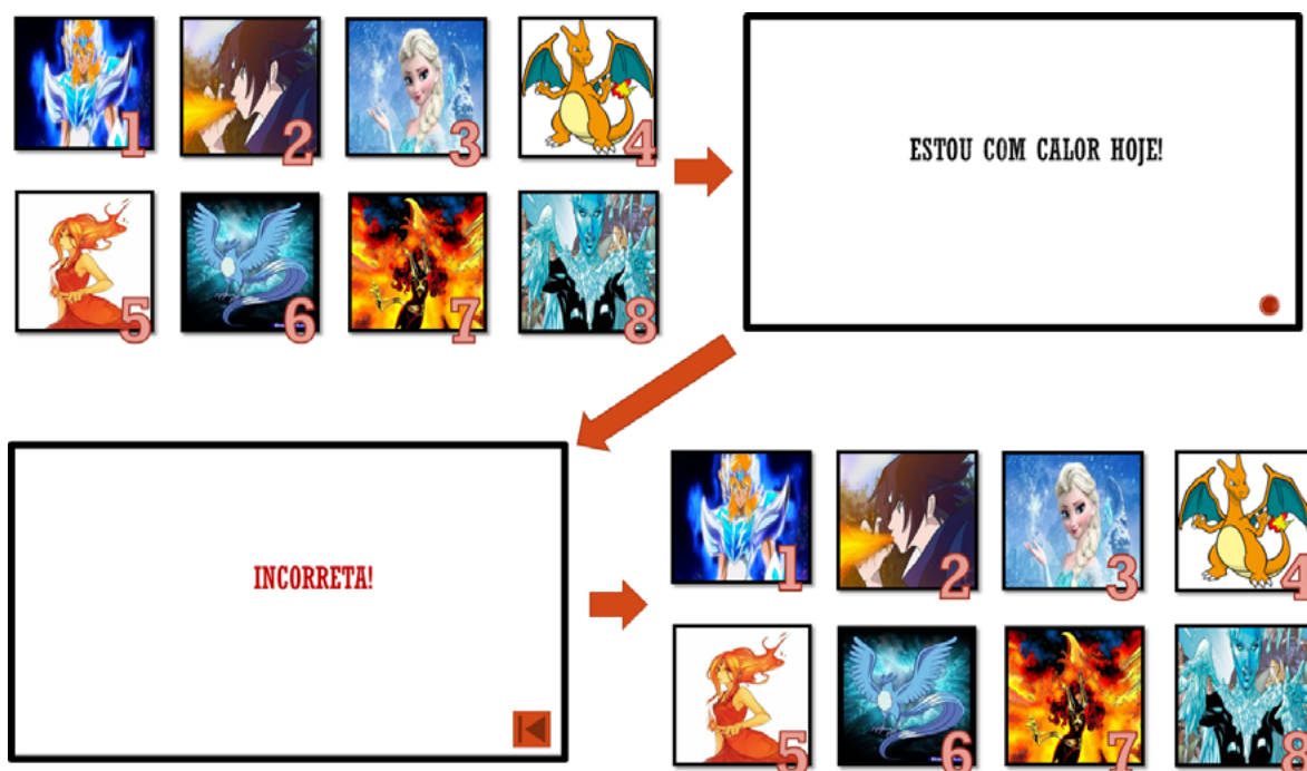
Figura 1 – Painel Interativo