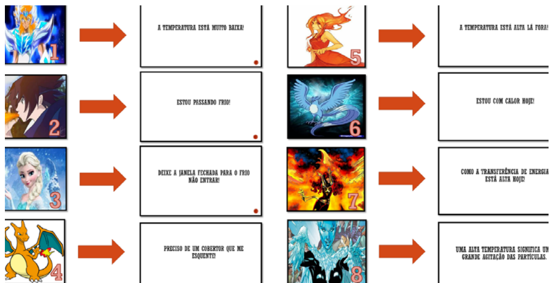
Figura 2 – Frases remetidas