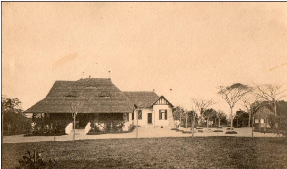
Figura 10 - Casa de veraneio de Waldemar Bromberg/1906

ficava à beira rio – possuindo, inclusive, “guarda-barcos” e atracadouro próprio, o que facilitava a prática de esporte dos alemães no Guaíba. A residência de verão de Waldemar Bromberg priorizava espaço e conforto. A vasta cobertura do telhado protegia do forte calor dos meses mais tórridos, proporcionando, assim, bem-estar aos frequentadores da propriedade. O avarandado, típico de casas de veraneio, servia para melhor acomodar a família e aos convidados. Sendo o atrativo maior, as águas limpas do Guaíba, a escada de poucos degraus levava até a praia. A chácara também possuía jardins bem ornamentados, árvores centenárias e um piso de grama bem ao estilo alemão.