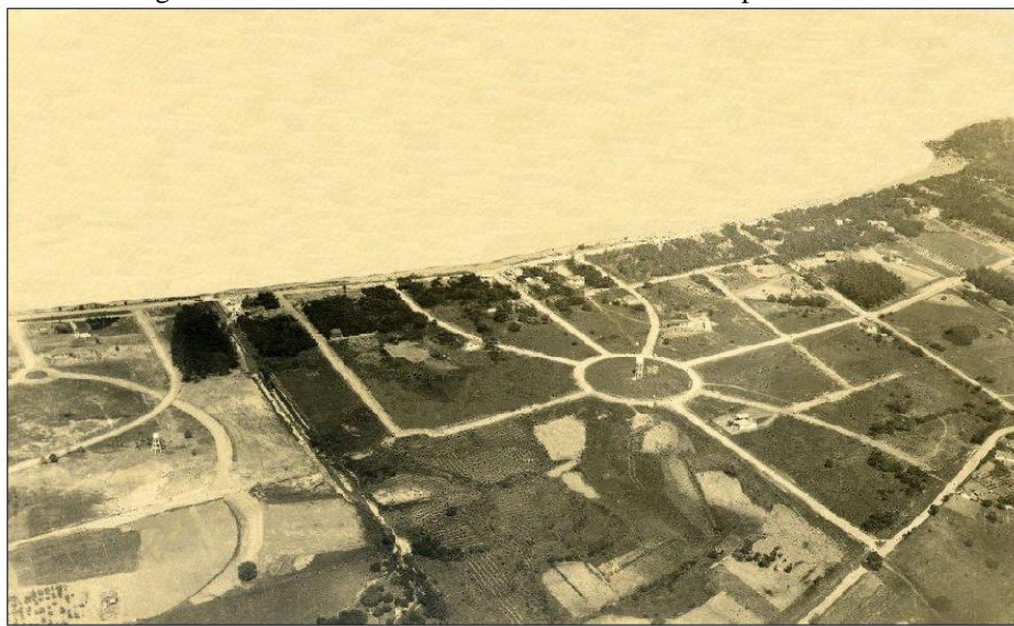
Figura 12- Vista aérea do loteamento do Balneário Ipanema/1931