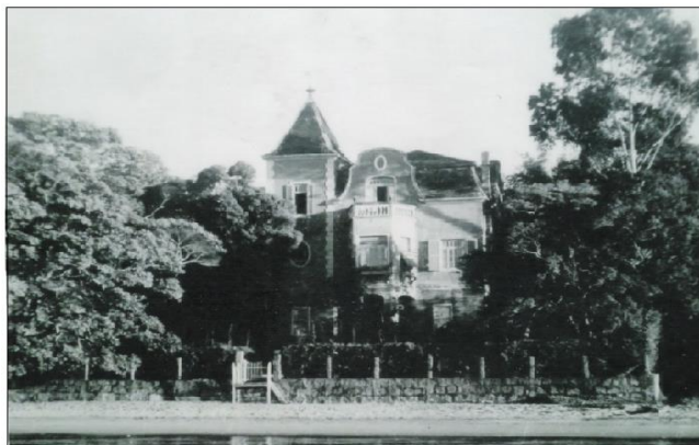
Figura 2 – casa de veraneio da família Fleischuts na Pedra Redonda/1930

Os alemães de que fala Helga eram grupos que buscavam o descanso e o lazer à beira do Guaíba e, para isso, mantinham chácaras e confortáveis residências para uso familiar, como é o caso da belíssima vivenda de verão da família Fleischuts, situada no balneário da Pedra Redonda. Atualmente, no local está a sede da associação esportiva da Caixa Econômica Federal.