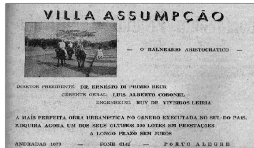
Figura 11 - Anúncio divulgando o novo balneário/1938