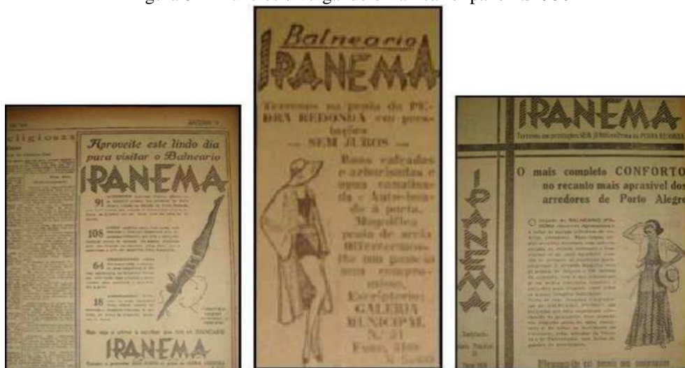
Figura 8 - Anúncios divulgando o Balneário Ipanema/1930