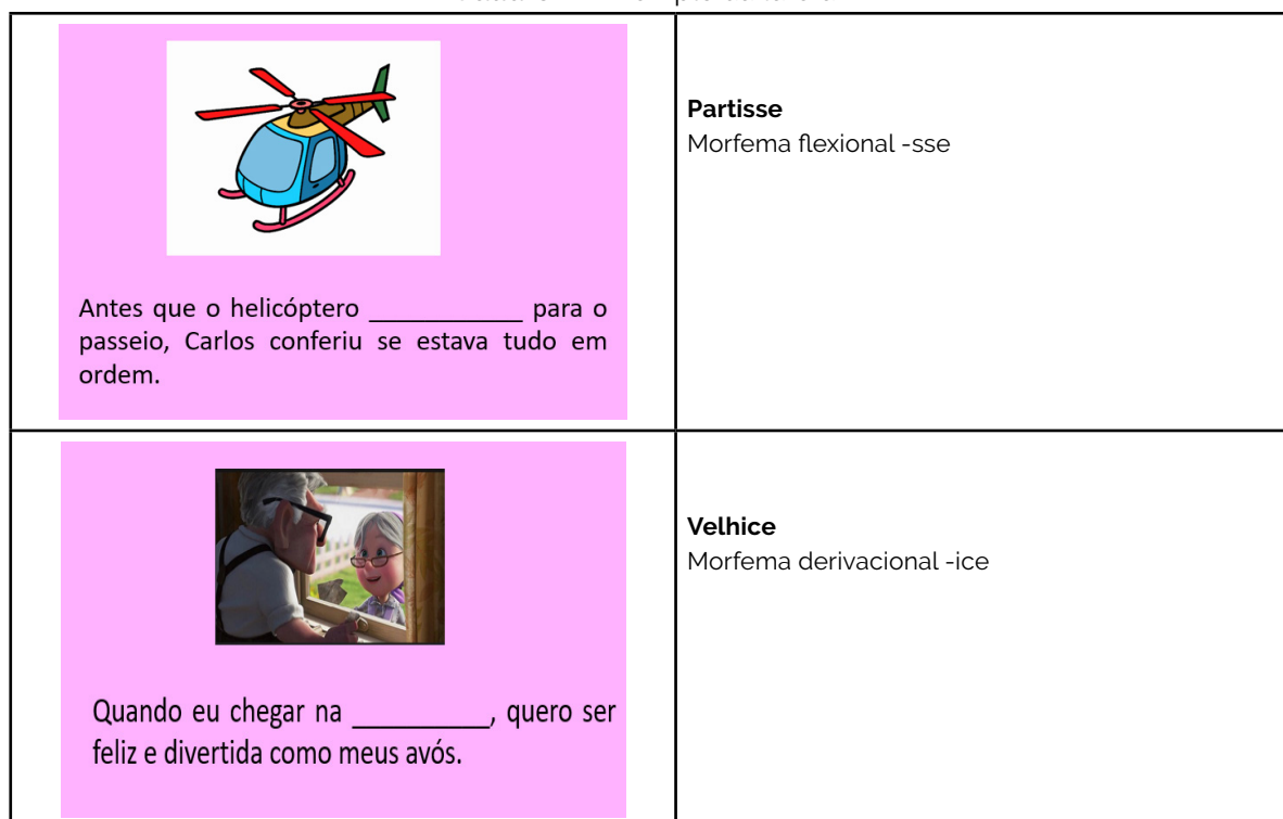
Quadro 1 – Exemplo da tarefa 1

No material, há uma lacuna para ser preenchida por cada um dos estudantes. O quadro 1 ilustra o instrumento: cada cartão contém um dos sufixos em análise e as palavras foram escritas pelo estudante, após a apresentação da tarefa pela pesquisadora.