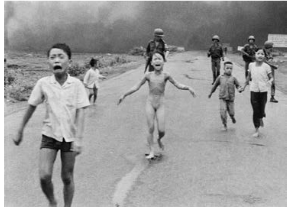
Figura 11 – O terror da guerra

De modo análogo, outros artistas também levantaram questionamentos importantes ao criar obras dotadas de grande potência de contestação. Na sequência, são apresentados dois desses trabalhos com o intuito de ilustrar a hipótese aqui defendida: