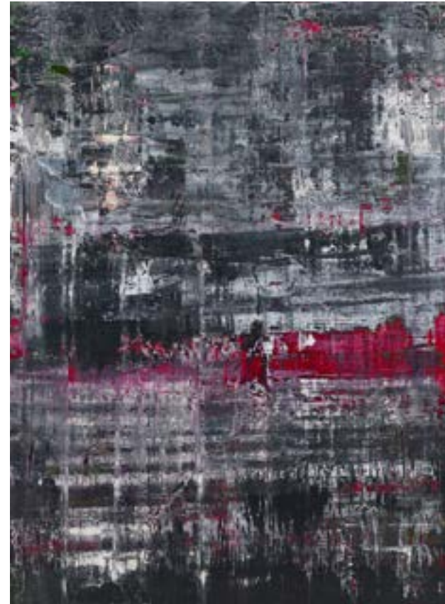
Figura 2 – Tela n.º 2