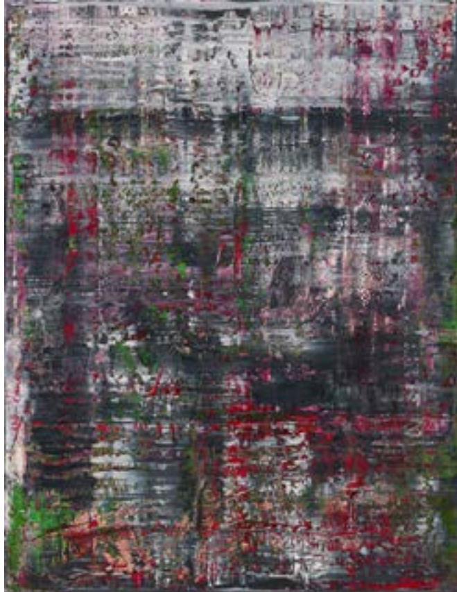
Figura 3 – Tela n.º 3