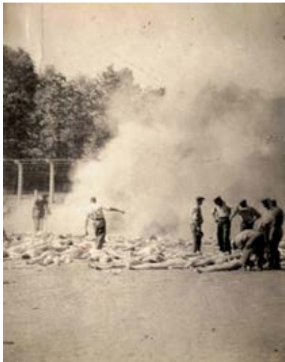
Figura 9 – Recorte do negativo n.º 278

Nota: Imagem ampliada e aprimorada da cremação dos corpos realizada pelo Sonderkommando