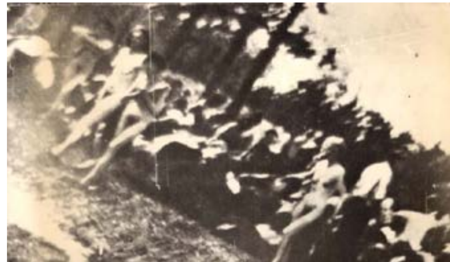
Figura 10 – Recorte do negativo n.º 282

Imagem ampliada e aprimorada de mulheres nuas momentos antes de serem executadas.