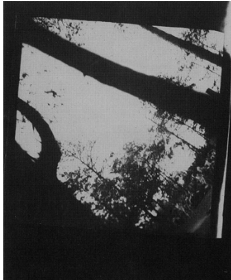
Nota: Mulheres prestes a entrar na câmara de gás.