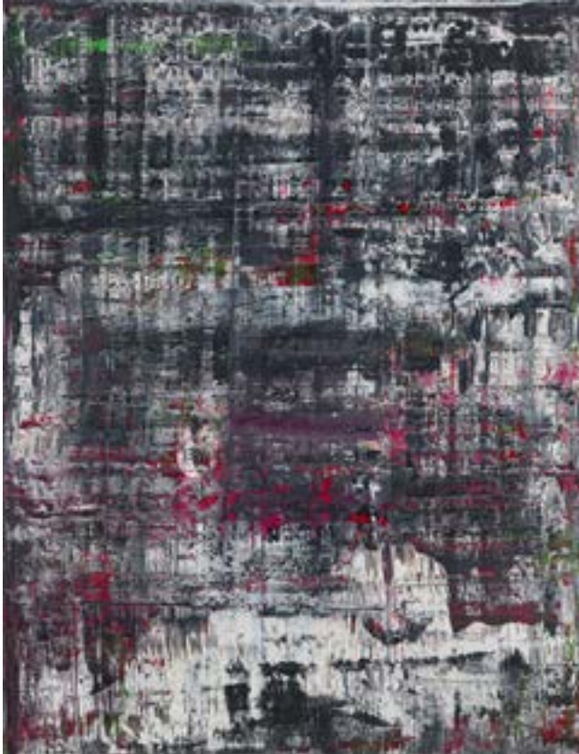
Figura 1 – Tela n.º 1