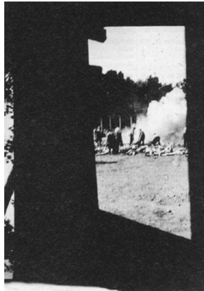
Figura 5 – Negativo n.º 277

Nota: Eliminação de corpos observada à distância