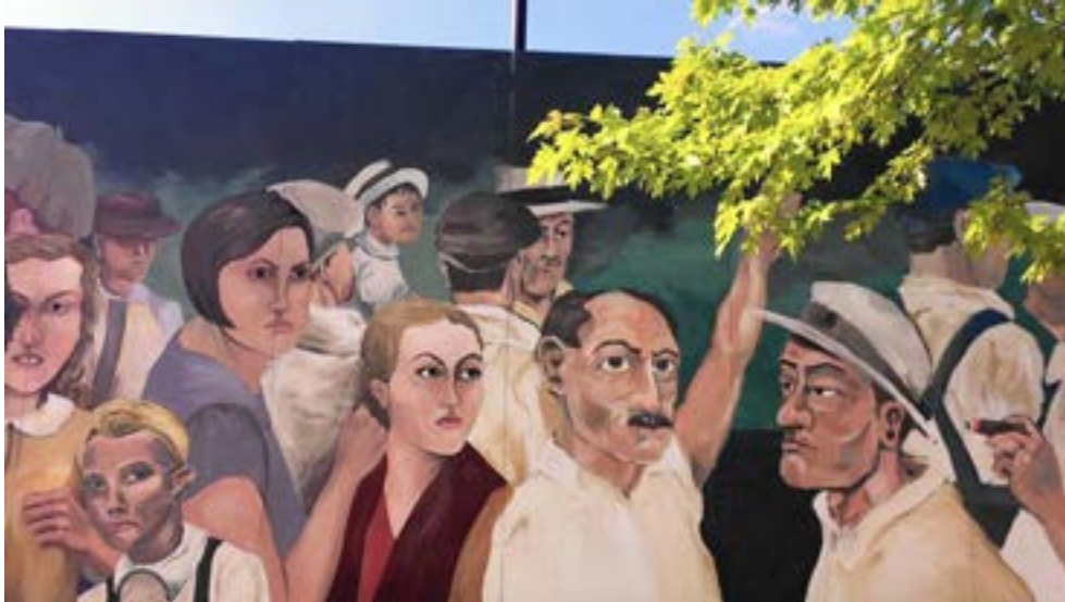
Figura 14 – American nocturne : referência perturbadora

Nota: Reprodução do mural criado por David Powers e exposto nas ruas de Elgin de 2007 a 2016.