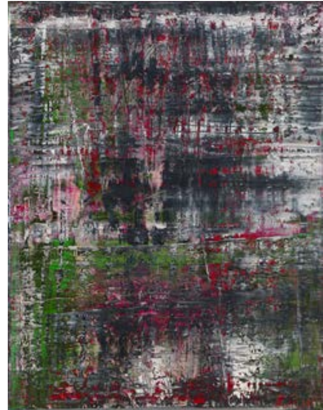
Figura 4 – Tela n.º 4