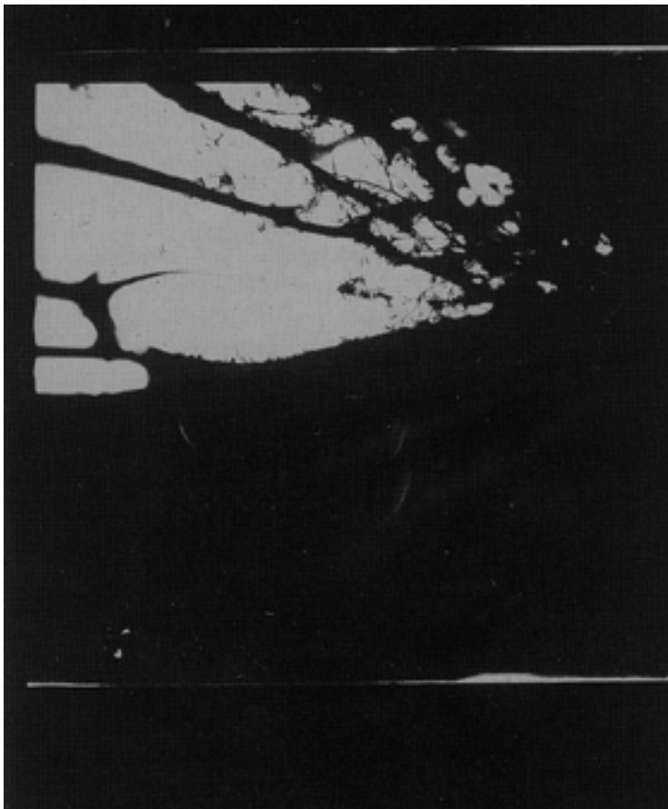
Figura 8 – Negativo n.º 283