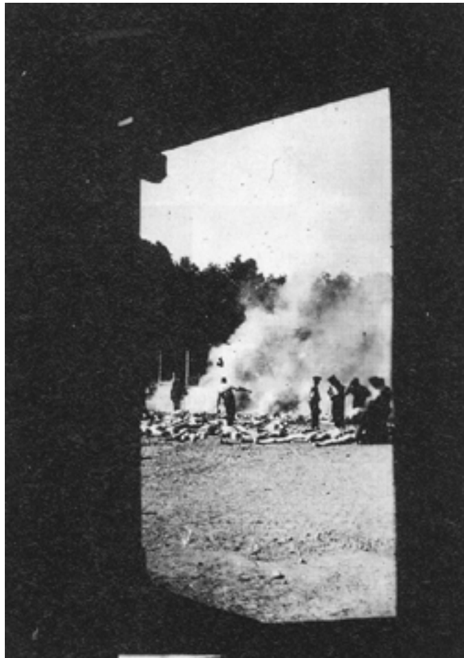
Nota: “Cremação” em vala comum.