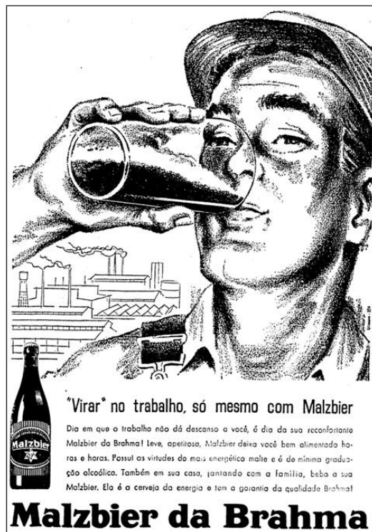
Figura 3 – Anúncio publicitário da cerveja Brahma, ano 1960