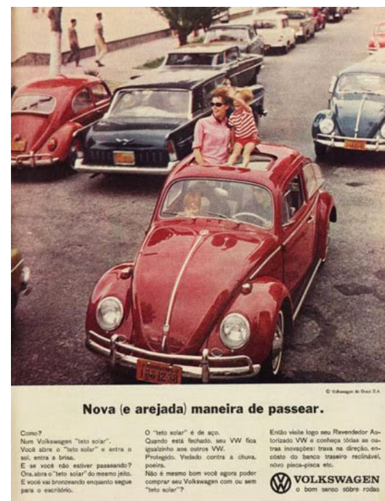
Figura 7 – Anúncio publicitário do automóvel Fusca da Volkswagen, anos 60.