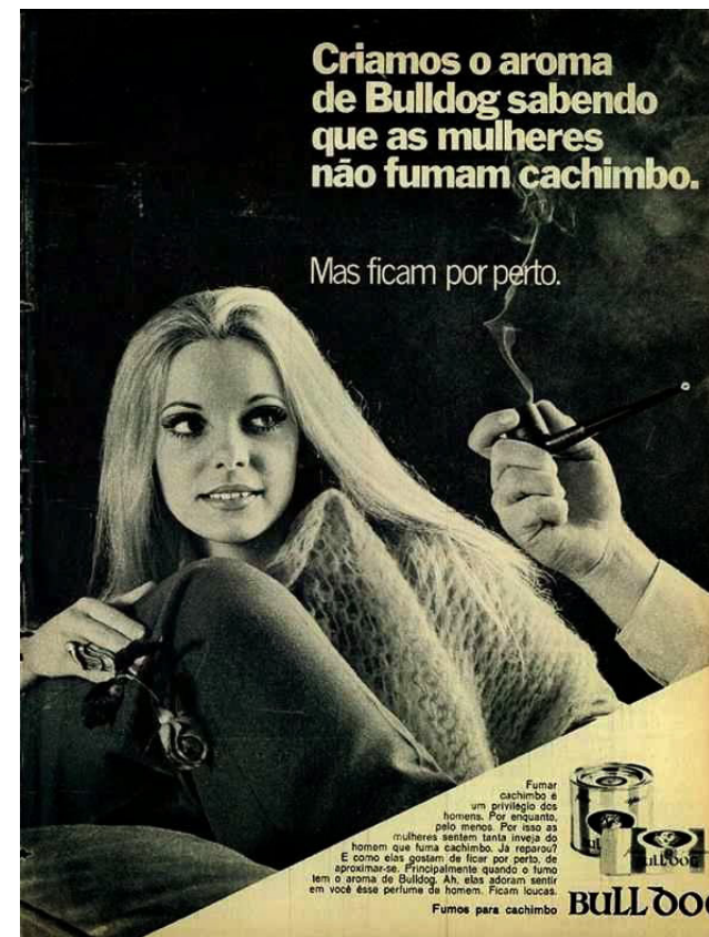
Figura 5 – Anúncio publicitário cachimbo Bulldog, 1969.