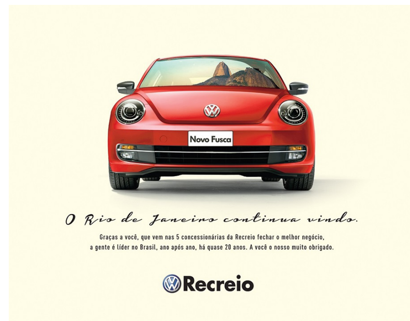
Figura 8 – Anúncio publicitário do Novo Fusca da Volkswagen, 2013.