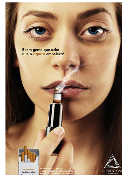
Figura 6 – Campanha publicitária de combate ao cigarro, 2012.