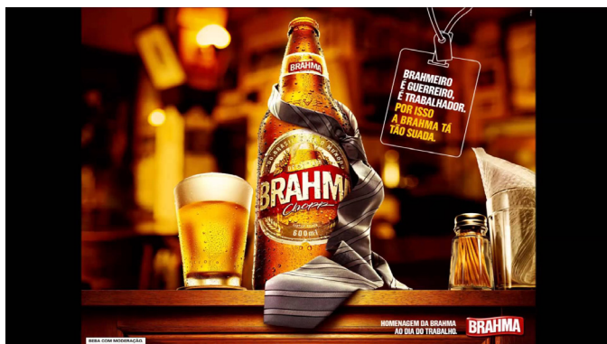
Figura 4 – Anúncio publicitário da cerveja Brahma, 2012.