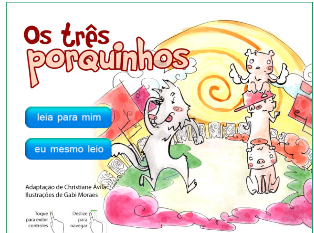
Figura 2 – Adaptação de Os Três Porquinhos