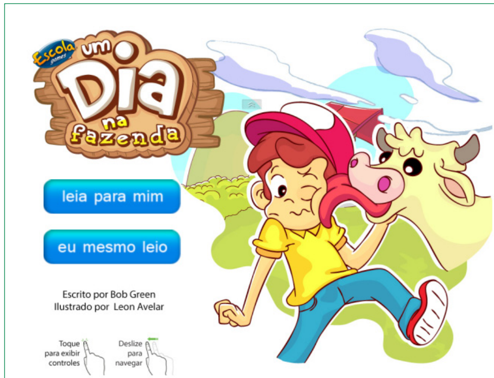
Figura 1 – Um dia na fazenda

Fonte: < http://www.escolagames.com.br/livros/umDiaNaFazenda/ >.