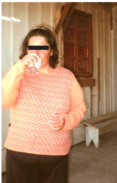
Figura 2 – A satisfação em tomar água, algo restrito antes do transplante.

Um elemento que apareceu na pesquisa tanto através das entrevistas como também das fotografias é a restrição à ingestão de água, que é muito limitada enquanto fazem o tratamento. É na água onde parecem condensar-se todas as perdas e restrições a que estão submetidos durante este período.