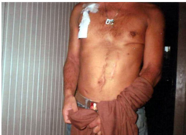
Figura 4 – As marcas corporais deixadas durante o tratamento pré-transplante.

sua fala teve tom de revolta, mostrando que ele ainda não aceita a ideia de ter que conviver com tais marcas, dores e inseguranças em relação a si e seu corpo.