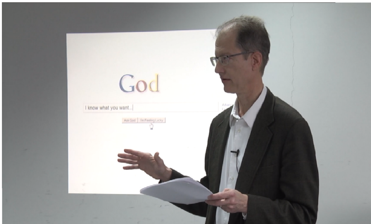
Imagem 1 – Conferência na Leuphana Universität Lüneburg, Alemanha, em 2016