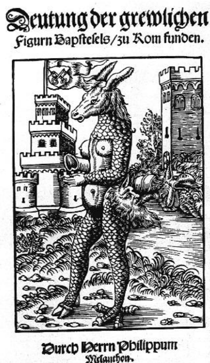
Figura 1 – O Papa Asno

Fonte: Captura de imagem do site Khronos Historia . 5