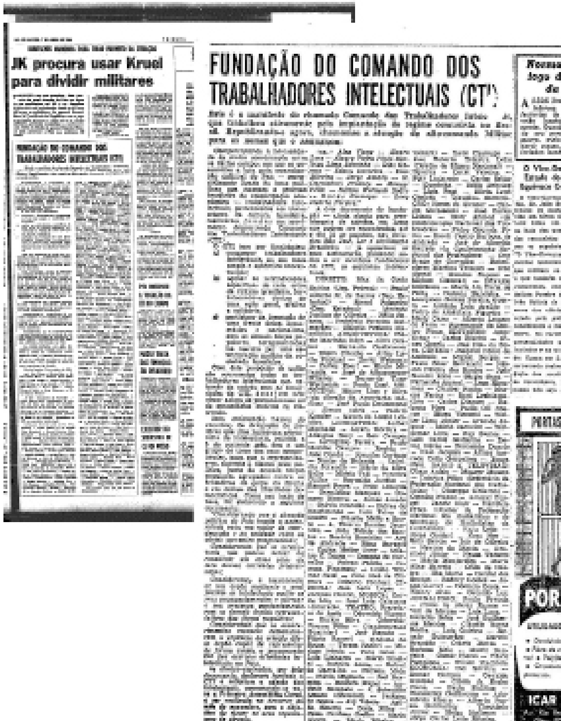
■ Fig. 3 - Anúncios em O Globo e Tribuna da Imprensa disfarçados como A pedido para delatar 214 intelectuais simpatizantes do governo deposto.