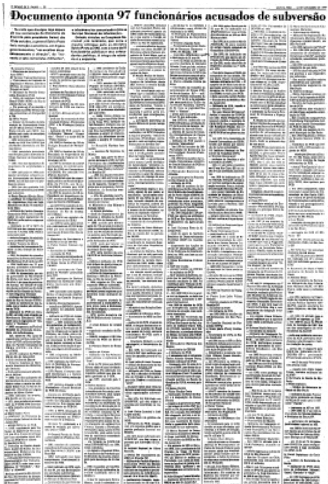
■ Fig. 6: Lista publicada em 1977 com 96 pessoas consideradas comunistas.