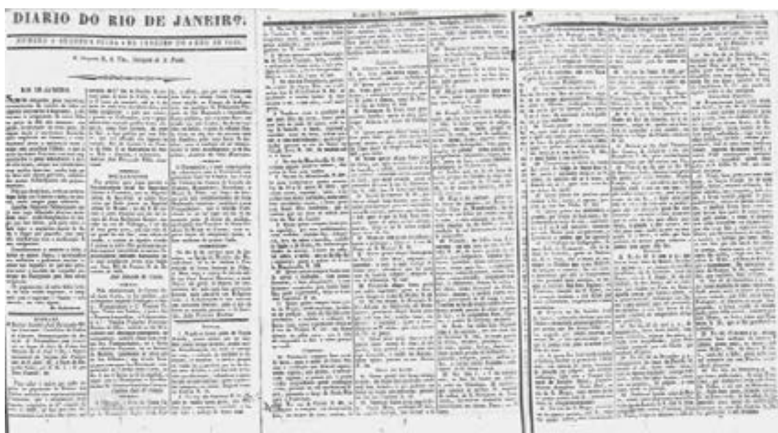
■ Fig. 1 - Diário do Rio de Janeiro , 4 jan. 1830: venda, compra, aluguel, leilão e caça a escravos.

sobreditas” –, e provisões municipais e provinciais para intimar quem acoutasse ou consentisse com a presença de escravos fugidos na casa ou propriedade. “Fugio hum escravo por nome Manoel, de Nação Moçambique, com os signaes seguintes [...] o annunciante tem noticia que o mesmo escravo esta accoitado em huma casa nesta cidade, por enquanto se faz o presente annuncio, para a todo o tempo senão chamar a ignorancia, e ficar sugeito ao que a ley determina; quem o conduzir a rua do Rosario n. 92, 2º andar, será bem recompçado”, alertava o Diário do Rio de Janeiro , na edição do dia 6 de março de 1826.