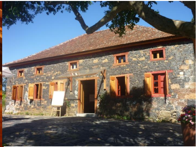
Imagem 09: Casa Righesso - salumeria