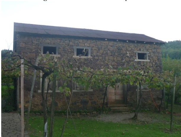
Imagem 04: Cantina e Casa Strapazzon.

cantina pelo Projeto Caminhos de Pedra, essa foi a primeira casa do roteiro a receber um grupo de turistas, provenientes de São Paulo e onde foram gravadas algumas cenas do filme o Quatrilho, uma adaptação do romance de José Clemente Posenato.