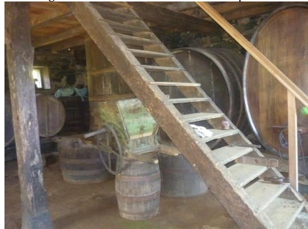
Imagem 05: Interior da Cantina e Casa Strapazzon.