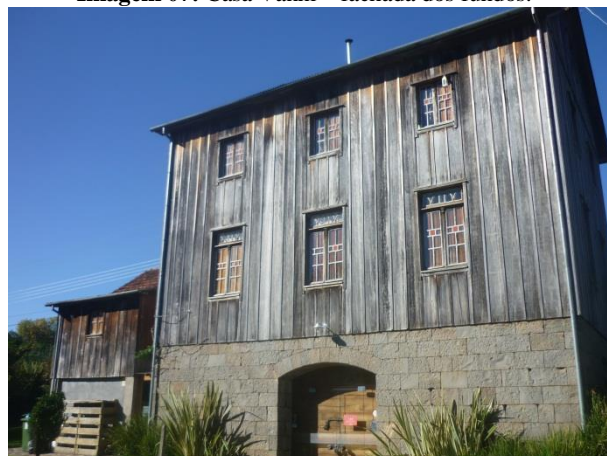
Imagem 07: Casa Vanni – fachada dos fundos.