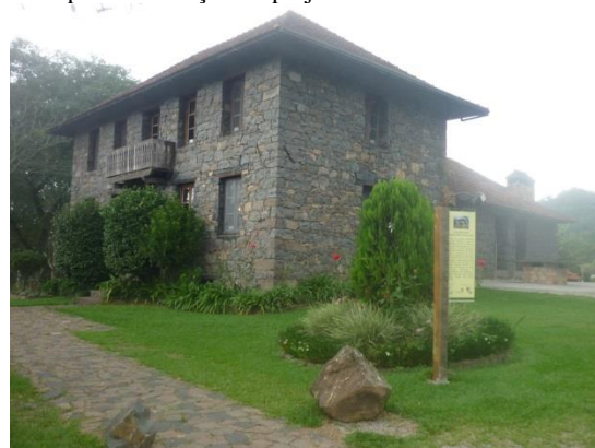
Imagem 03. Restaurante Nona Ludia – Casa Bertarello após intervenção do projeto Caminhos de Pedra.

Fonte: http://www.caminhosdepedra.org.br