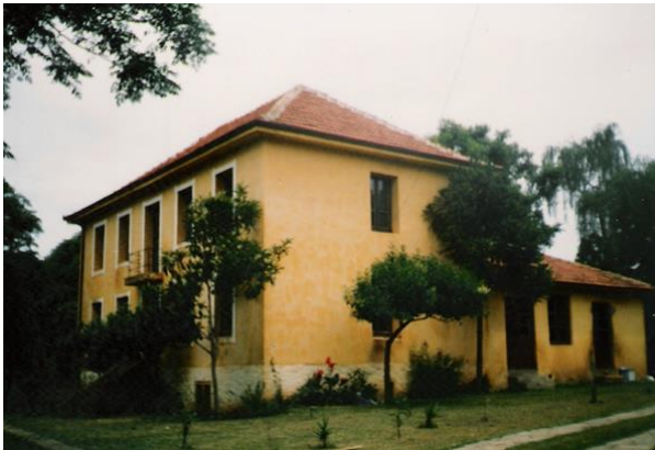
Imagem 02. Restaurante Nona Ludia – Casa Bertarello