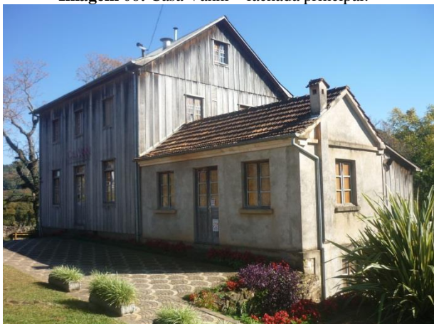
Imagem 06: Casa Vanni – fachada principal.

A imagem 05 representa a casa Vanni, construção em madeira, erguida em 1935 por Pietro Strapazon, possuindo um porão semi-enterrado de pedras de cantaria, perfeitamente cortadas e encaixadas. Hoje o subsolo foi transformado em restaurante pelo projeto Caminhos de Pedra. Uma das vantagens da sustentação da casa utilizando pedras é manter a madeira longe do contato com o solo, portanto livre de umidade.