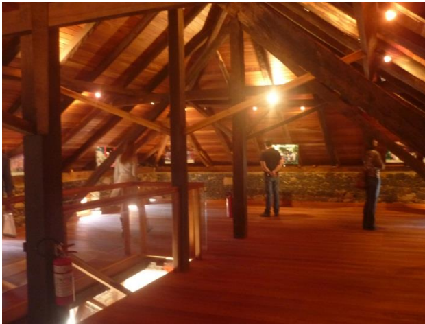
Imagem 08: Sótão da casa Righesso - salumeria

A imagem 08 e 09 trata da Casa Righesso, moradia construída em 1889, em pedras de basalto irregular de cor preta, unidas entre si com uma mistura de feno, palha e estrume de vaca. Essa residência era originalmente coberta por tabuinhas, também conhecidas como scándole (peças de madeira que possuíam aproximadamente cinquenta centímetros de comprimento por vinte centímetros de largura), atualmente a cobertura foi substituída por telhas de barro, devido a pouca resistência desse material. Restaurada no ano de 2007, onde desde meados de 2012 funciona a salumeria, local em que o visitante pode conhecer a história e a tradição dos embutidos, degustar e adquirir o produto.