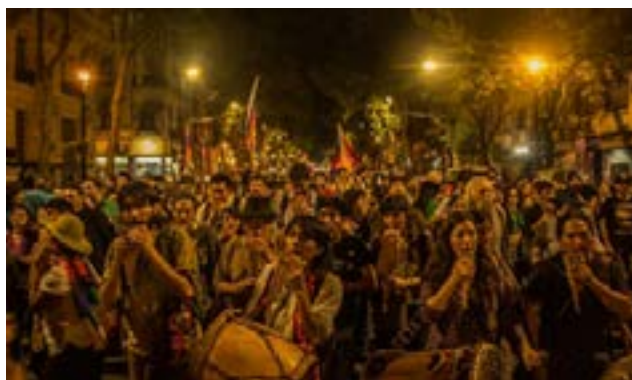
Fotografía 1 – “La marcha del 12 de octubre en Buenos Aires”. 2016.