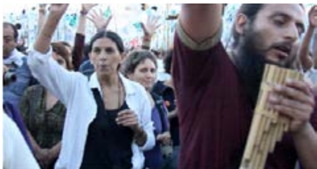
Fotografía 5 – “Se hace vida con el Sol”. Año 2011.