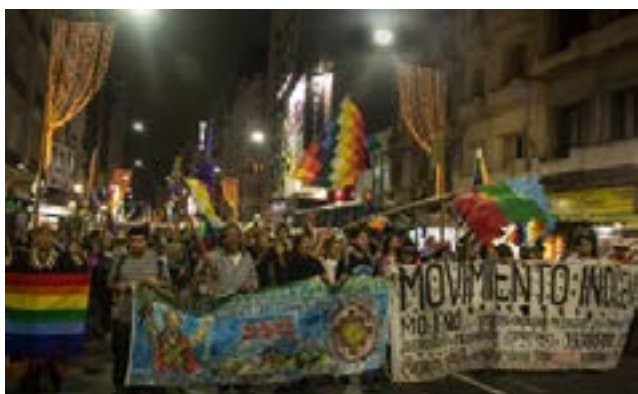
Fotografía 6 – “La marcha de todos los pueblos”. Año 2016.

Una lectura de esta reivindicación amerindia en general, responde a la variopinta representación de pueblos que actualmente conviven en la ciudad producto de una relevante concentración migratoria amerindia tanto interna como internacional. En esta marcha, además de la presencia mayoritaria de qollas, aymaras y quechuas, participan miembros de otros pueblos que históricamente han habitado el actual territorio argentino y que algunos de sus miembros han migrando a Buenos Aires. Este es el caso de diaguitas, guaraníes, qom, mapuches y wichís, quienes han incrementado considerablemente su representación en el abanico reivindicativo amerindio de esta capital durante el siglo XXI.