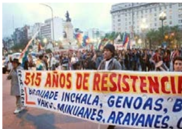
Fotografía 2 – “Más de 500 años resistiendo”. 2007.

¿Por qué en Buenos Aires, una metrópolis del sur alejada del Caribe, la marcha conmemorativa 5 que condensa las reivindicaciones amerindias se lleva a cabo el día que se asume que habrían llegado por primera vez los españoles al macro-continente, y no así, por ejemplo, cuando comenzara el genocidio del pueblo querandí, el 2 de febrero de 1536, día en que Pedro de Mendoza fundara la ciudad? (PIGNA, 2002, p. 89), o, considerando que gran parte de los protagonistas de esta marcha nacieron en los Andes centrales, ¿Cuándo asesinan al inca Atahualpaca, el 26 de junio de 1533? (ROSTWOROWSKI, 1983, p. 112).