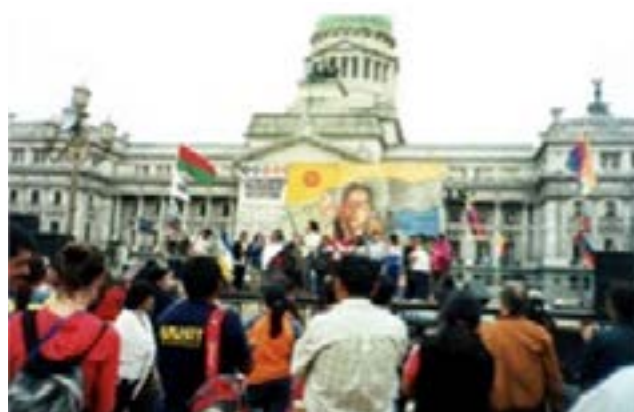
Fotografía 4 – “Convocándose para marchar”. Año 2006.

Antes de la marcha se monta un estrado frente al Congreso Nacional sobre la avenida Callao, en el cual participan grupos musicales denominados “criollos”, compuestos de guitarra, charango, siku y quena, entre otros instrumentos. En algunos conjuntos tocan sikuris que luego se suman a la marcha como sopladores. La marcha comienza después de que estos se presentan, instancia que sirve para que los concurrentes se concentren a la espera de su comienzo.