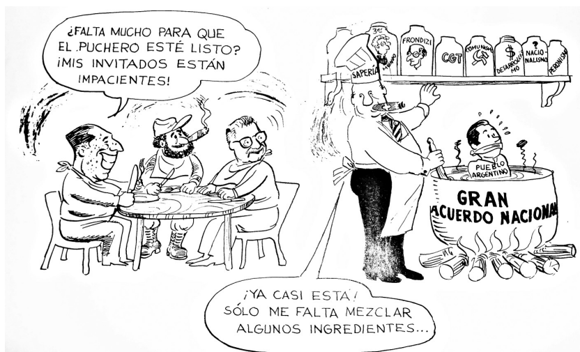
Figura 5. A “incógnita” do Grande Acordo Nacional Legendada dos ingredientes: 3º Mundo, Frondizi, CGT, Comunismo, Desenvolvimentismo, Nacionalismo, Peronismo. (Manifesto “Ver, Juzgar y Actuar”, 1ª parte: Panorama de la situación actual. Acervo da autora.)

Em tal cenário, por si desalentador, como decorre da leitura atenta do VJA, outros elementos tornariam ainda mais complexa a realidade argentina de 1971. O governo atual, segue o manifesto, é indefinido e suas características doutrinárias não seriam em nada tranquilizadoras, situação corroborada pela política de queda de barreiras ideológicas e pelo benefício que o GAN lega ao peronismo e à esquerdização do país (Fig. 5), pela correspondência entre alguns dos pontos do “programa socialista” da Confederação Geral do Trabalho (CGT), pelo terrorismo urbano que manteve atuação constante nos últimos anos, pela falta de doutrinas claras e de lideranças dos anêmicos e frágeis partidos