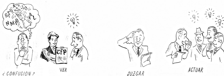
Figura 1. “Ver, Juzgar y Actuar” por una Argentina auténtica y cristiana (título original) (Manifesto “Ver, Juzgar y Actuar”, 2ª parte: Coincidencias por el derrumbe. Acervo da autora.)

O primeiro fascículo do manifesto inicia deixando claro aos leitores a motivação tefepista em produzir e difundir tal análise. Apelando a uma autocaracterização altruísta e pugnadora, evidencia-se que o país está mergulhado na confusão “mais peligrosa de nuestra história” (VJA, 1971a, p. 02), pois seu movimento de fundo é o avanço do comunismo, ateu e igualitário, nas plagas argentinas. A TFP, como paladina da defesa da civilização cristã, segue o texto, cumpriria mais uma vez seu dever e diria a verdade. A apresentação da TFP como entidade que não pode se omitir de auxiliar a luta contrarrevolucionária é constante em suas produções e discursos. Iniciando e, muitas vezes, findando manifestos e livros, essa mensagem apela a uma empatia dos interlocutores pela constante e abnegada ação de sócios e cooperadores da entidade em prol do bem comum via análise e exposição de questões da atualidade e, como fim maior, da orientação da conduta desses. Para além da mensagem textual, VJA traz também imagens que reforçam essa representação guerreira, singular (em geral se prostram como únicas vozes dissonantes aos contextos de sua atuação), impertinente (para os pretensos opositores), pré-conceituosa (aqui especialmente com os hippies) e, por que não, generosa dos prosélitos da TFP, como vemos nas duas ilustrações a seguir.