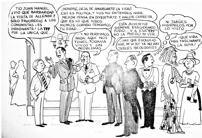
Figura 2. Alertas da TFP ante a visita de Allende e a queda de barreiras ideológicas (Manifesto “Ver, Juzgar y Actuar”, 1ª parte: Panorama de la situación actual. Acervo da autora)

Partindo do pressuposto de que a grande ameaça constitui-se do comunismo, seja filosófica que mentiria, dissimularia e ocultaria em seu plano de expansão imperialista para dominar o mundo, a TFP defende que acreditar que o país esteja livre desse perigo é uma prova de anacronismo e também de cegueira política, daí seu incessante alerta à opinião pública.