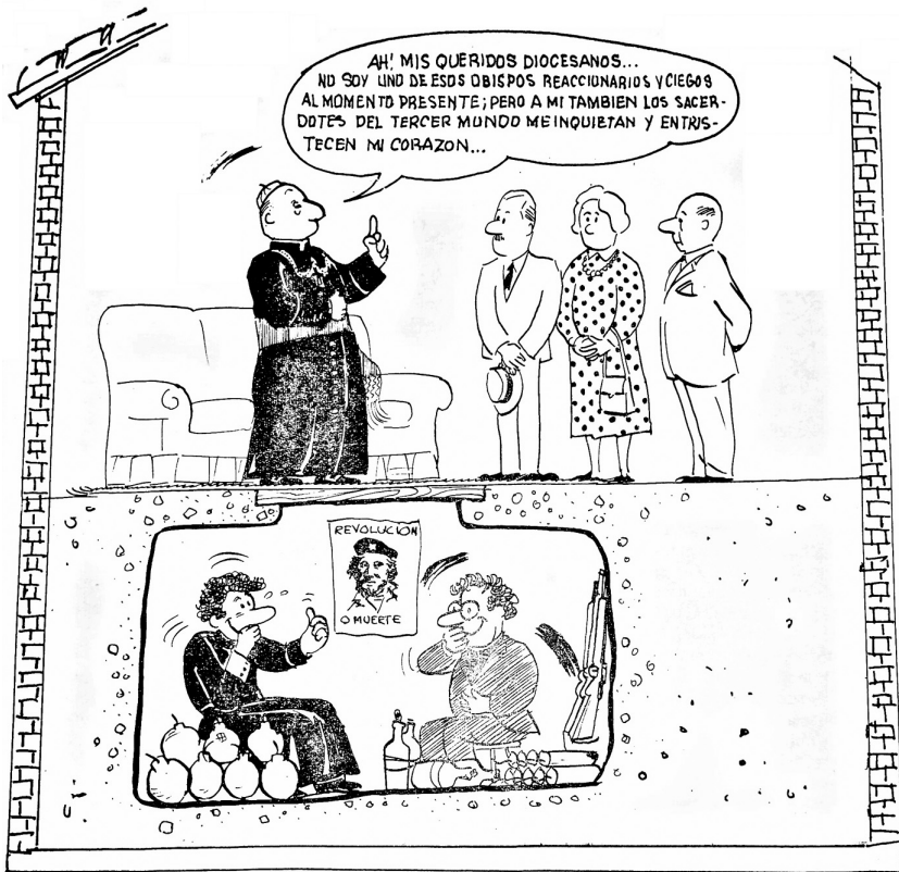
Figura 3. A Igreja “minada” pelo progressismo católico (Manifesto “Ver, Juzgar y Actuar”, 1ª parte: Panorama de la situación actual. Acervo da autora.)

Estos se colocan en una supuesta equidistancia entre los Sacerdotes para el Tercer Mundo y los que ellos califican como ‘reaccionarios’. Sientan plaza de ‘moderados’, ‘bien centrados’, etc. Suportan, inclusive, algunos ataques verbales de los sacerdotes izquierdistas. Con eso, ganan la confianza de la mayoría de los católicos, que piensan que el mal mayor está en los métodos del clero subversivo, y no en sus fines, que no siempre conocen con suficiente claridad (VJA, 1971b, p. 06).