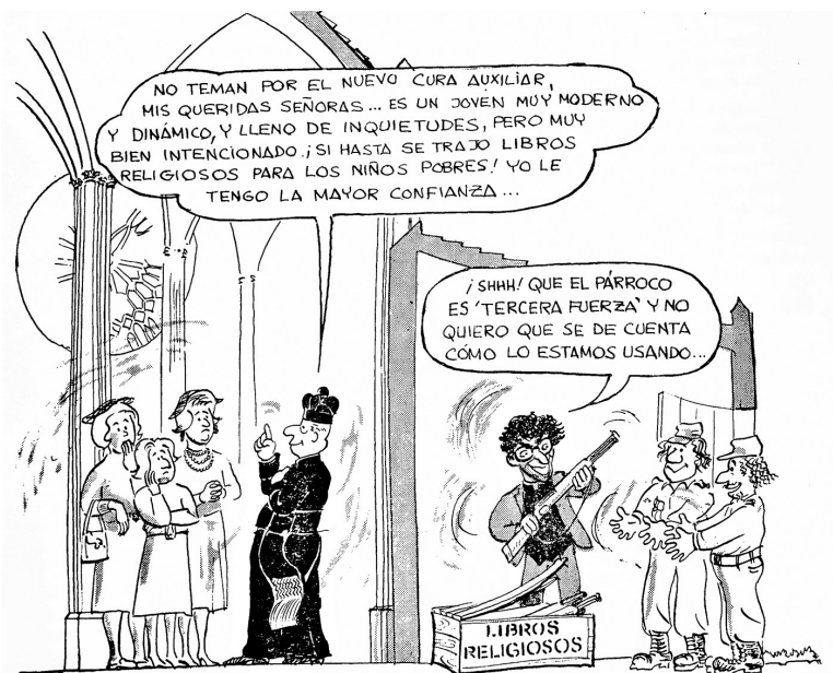
Figura 4. O clero terceira força (Manifesto “Ver, Juzgar y Actuar”, 2ª parte: Coincidencias par el derrumbe.)

A avaliação da TFP é de que o clero terceira força se constitui em aparato de uma máquina de baldeação ideológica inadvertida, ou seja, parte de uma mudança nos estados de ânimo do argentino que, via processos psicológicos e ideológicos, leva aos poucos a aceitar o comunismo. Não obstante, as advertências não param aí, visto que as denúncias tefepistas chegam a apontar a cumplicidade de religiosos ante as ações de guerrilheiros que seriam inclusive preparadas em espaços eclesiais – tema especificamente dirigido a grupos cristãos críticos que passaram da análise da realidade à ação para a transformação da sociedade de forma armada. Essa mensagem é fortalecida pelas imagens acima que reforçam o discurso de transladação ideológica ou mesmo de “lavagem cerebral” via ação ou tolerância – ingênua ou não – de membros da Igreja.