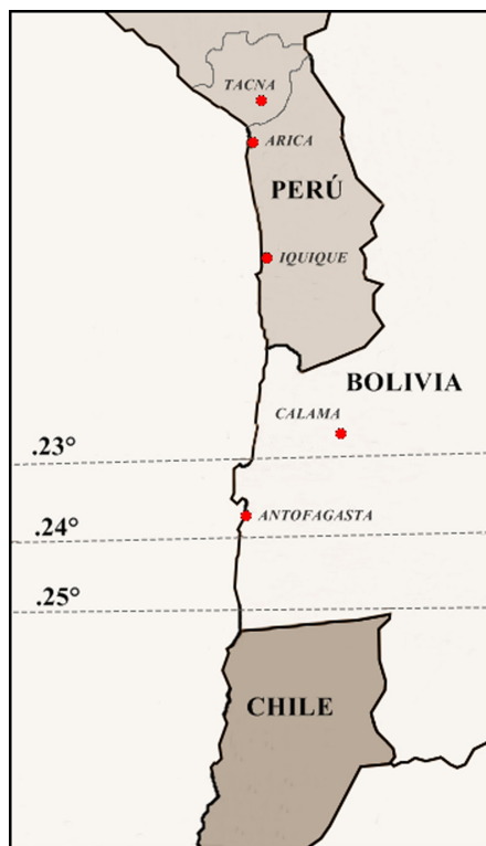
Mapa 4. Configuración territorial del Norte Grande chileno antes de la Guerra del Pacífico (1879). Elaboración: Humberto Choque Rodríguez.

Arica no siempre ha sido chilena y de hecho cuenta con solo ochenta y cinco años de serlo. La ciudad formaba parte de la República del Perú (Mapa 4), y solamente a fines del siglo XIX quedó en poder de Chile (Díaz et al., 2012, p. 160).