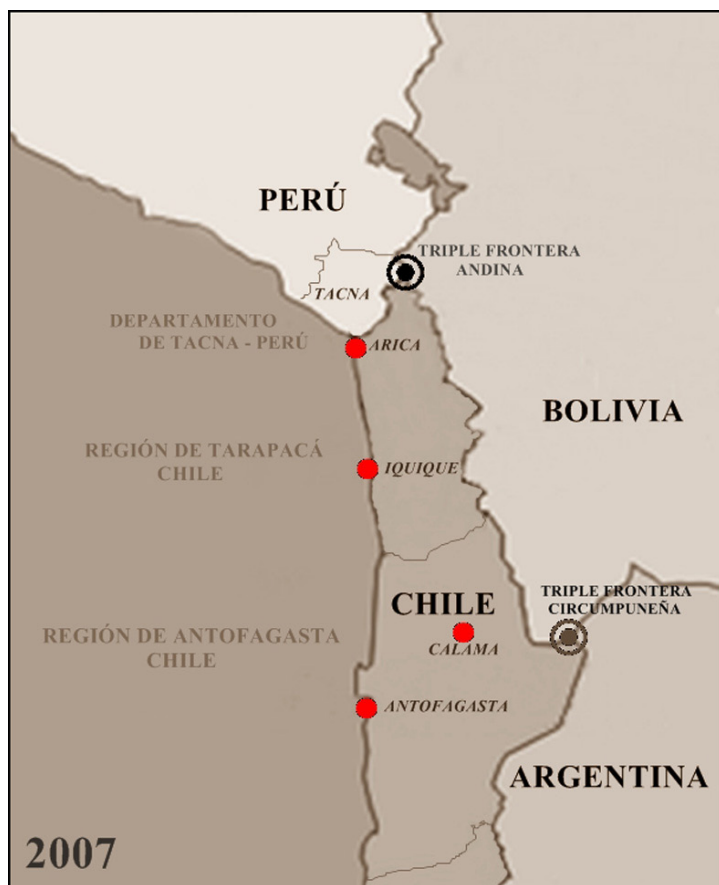
Mapa 2. Configuración territorial de la Región chilena de Tarapacá antes de la creación de la Región de Arica y Parinacota (2007). Elaboración: Humberto Choque Rodríguez.

territorio, provocado entre otras cosas por el éxodo rural desde las tierras altioplánicas hacia las ciudades de la costa en el Norte de Chile: proceso que se masifica desde los años 1960 en adelante debido a las políticas estatales “desarrollistas” o de “modernización” (Bähr, 1980; Gunderman y González, 2008; Gunderman y Vergara, 2009; Quiróz et al., 2011).