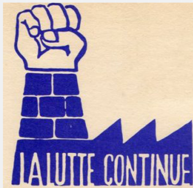
Figura 2: La lutte continue. Atelier Populaire, 1968.

Outra importante referência para o design social é o Atelier Populaire , grupo composto por estudantes e trabalhadores de Paris que atuou em maio de 1968 em resposta à situação social em que a França se encontrava. O grupo tomou conta da Escola de Belas artes de Paris e fez uso dos materiais lá disponíveis para imprimir cartazes de protesto, os quais fizeram parte de suas armas de luta e são propagados até hoje como referência na área, vide Figura 2. Segundo Rafael Tadashi Miyashiro (2011), havia a consciência de que a comunicação visual poderia ser utilizada para além do suporte estético, como ferramenta concreta e estratégica para questionar e propor novas atitudes.