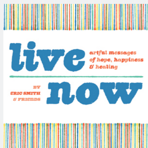
Figura 3: Capa Live now