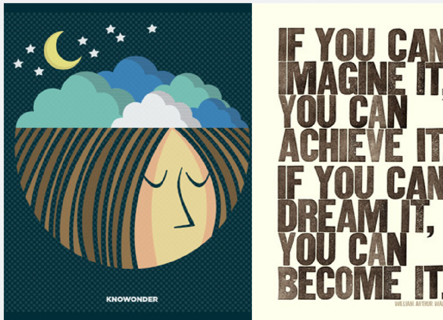
Figura 5: “Se você pode imaginar, você pode alcançar. Se você pode sonhar, você pode se tornar”