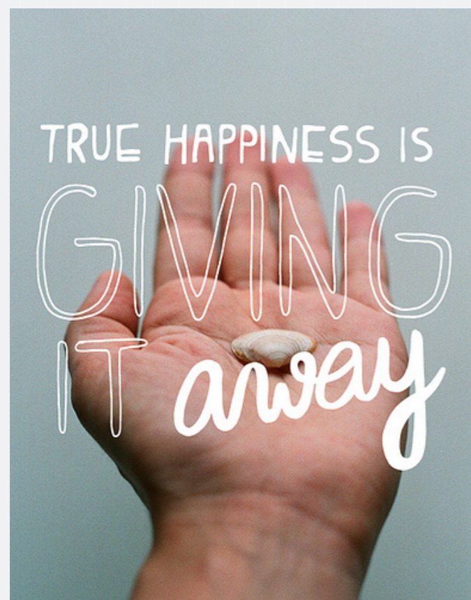
Figura 4: “A verdadeira felicidade é passá-la adiante”