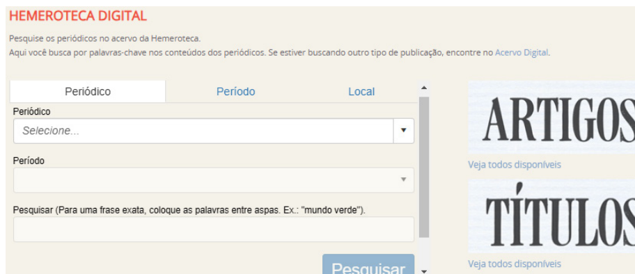
Imagem 1 – Interface do site da HBND (2024)

(BNDigital), criando a Hemeroteca digital Brasileira (HBND), um repositório on-line e gratuito que abriga mais de 8.000 periódicos circulados no Brasil entre os séculos XVIII e XXI. Na imagem 1, a seguir, a interface do site da HBND.