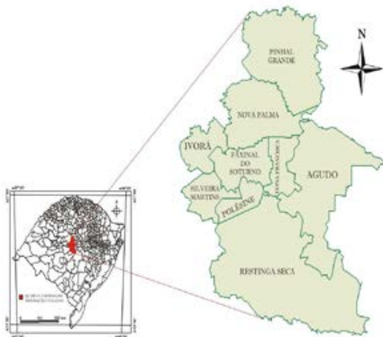
Figura 1 – Mapa de Localização das colônias italianas no Rio Grande do Sul

Fonte: Descovi Filho e Bertoldo (2007, p. 41).