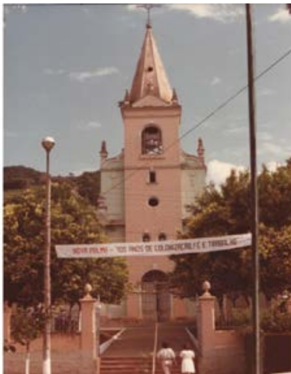
Figura 3 – Igreja Matriz de Nova Palma