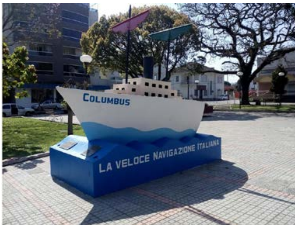
Figura 6 –1 Monumento do Imigrante – Faxinal do Soturno