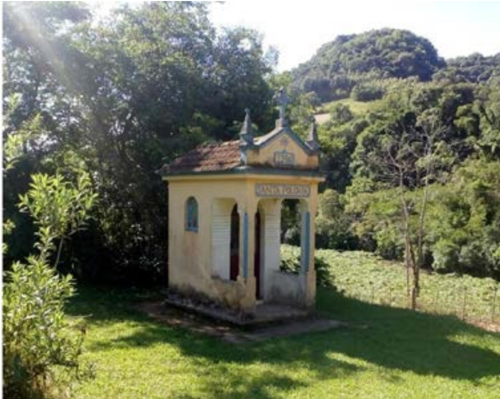
Figura 5 – Capitel a Santa Polônia

e auxiliavam na construção de uma memória positiva em torno dos imigrantes.