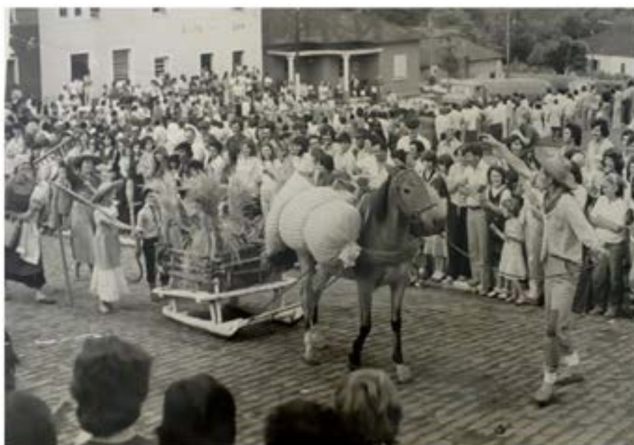
Figura 7 – Desfile histórico da imigração em Vale Vêneto