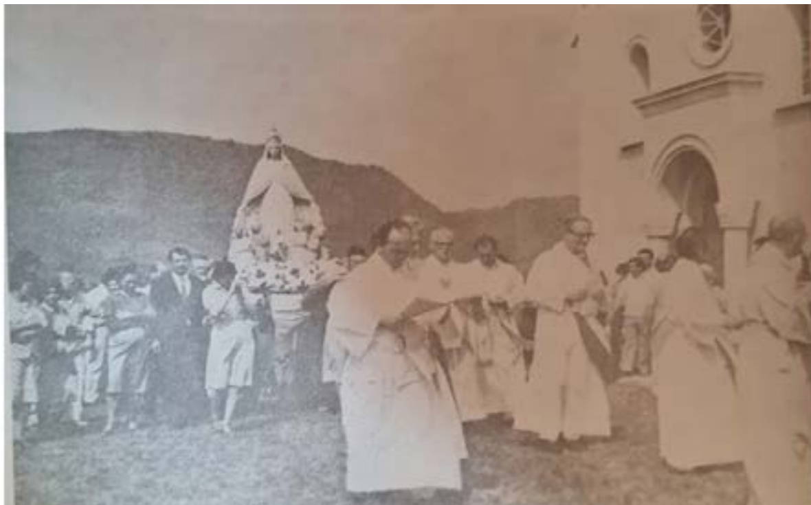
Figura 4 – Festa de Nossa Senhora do Monte Bérico, Val Veronês, 1982

buscassem suporte no passado, os indivíduos das comunidades da Quarta Colônia aproveitaram das festividades do Centenário para apresentar as práticas socioculturais do presente, como, por exemplo as festas dos padroeiros.