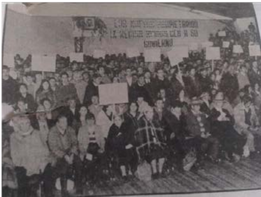
Imagen 1 – Entrega de títulos en Gimnasio de Nueva Imperial, nov. 1983