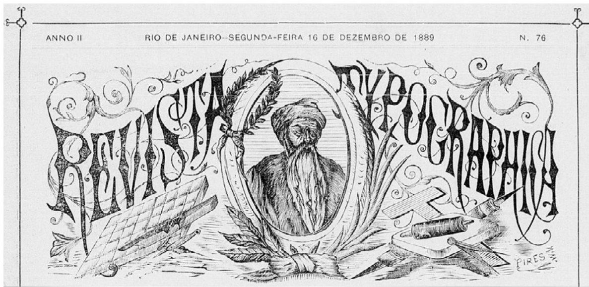
Figura 2 – Segundo cabeçalho da Revista Tipográfica

Fonte: Captura de tela no acervo da Hemeroteca Digital Brasileira da Biblioteca Nacional. 13