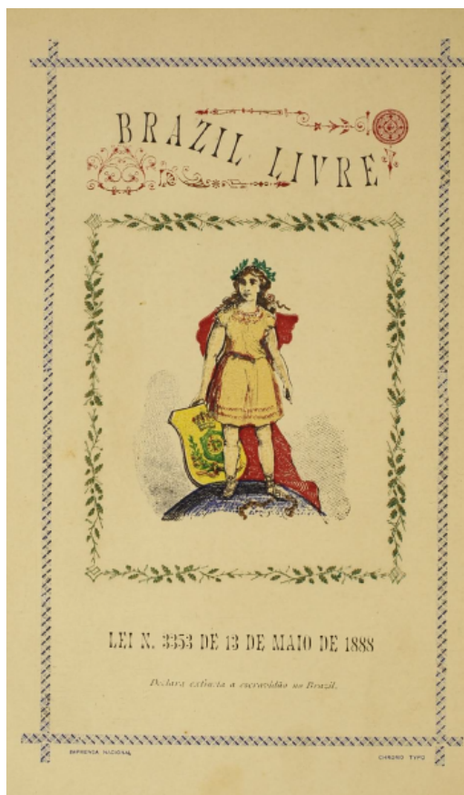
Figura 3 – Estampa cromo tipográfica na obra A festa das crianças

Estampa a nove cores, produzida segundo método de José Xavier Pires. Observa-se a menção cromo tipo à direita, na parte inferior.