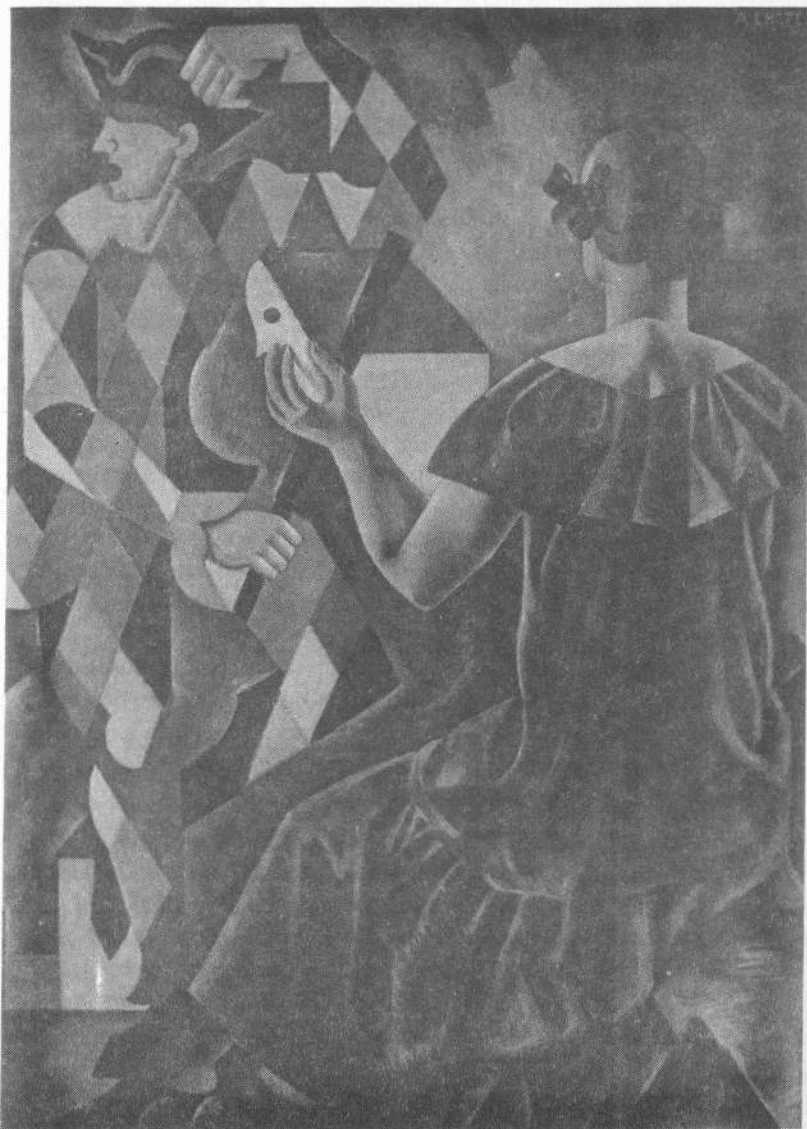
André Lhote, "Homenagem a Watteau", óleo, 116 x 89 cm, s/d.