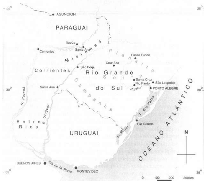
Mapa 1 – O campo de ação de Bonpland na América do Sul