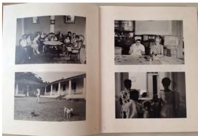
Imagem 1. Fotografias da série sobre a família baiana.

Em março de 1962, Claudia Andujar conviveu por alguns dias com uma família do Recôncavo Baiano. Esta família era dona de uma fazenda, o Engenho D’Água, e a fotógrafa registrou diversos aspectos do cotidiano tanto da vida íntima da família, quanto do trabalho na fazenda. É possível perceber um enfoque grande nas crianças, tanto as brancas, filhas da família, que são retratadas em seu quarto, ou brincando, quanto as negras, filhas dos empregados, retratadas na cozinha, tratando dos animais, ou estudando. A situação privilegiada da família também é ressaltada, muitas vezes por meio de um contraste com os empregados. Em especial, na fotografia que mostra a família sentada à frente da televisão e as pessoas que inferimos serem os empregados da casa, pois só os vemos de costas, de pé atrás, vendo a mesma televisão a partir da soleira da porta ( Imagem 1 ). Também foi fotografado o trabalho do corte da cana e da colheita do cacau.