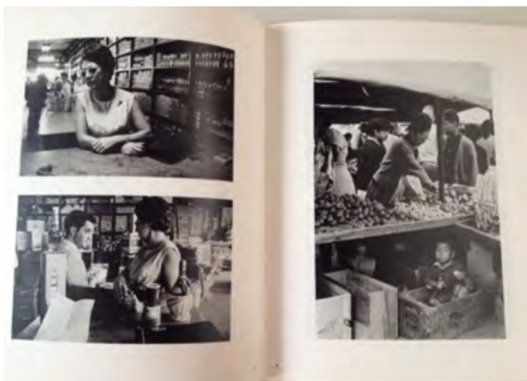
Imagem 2. Fotografias da série sobre a família paulistana.

No ano de 1964, Andujar deu continuidade ao projeto acompanhando por duas semanas uma família da cidade de Diamantina, no estado de Minas Gerais. As imagens mostram, por um lado, a atuação profissional do pai da família como médico em um hospital, e por outro, a grande religiosidade da família no espaço privado da casa, comandada pela mãe, que aparece rezando em um retrato. A fotografia do exterior da casa, um sobrado amplo, mostra também o carro da família, e indica que eles