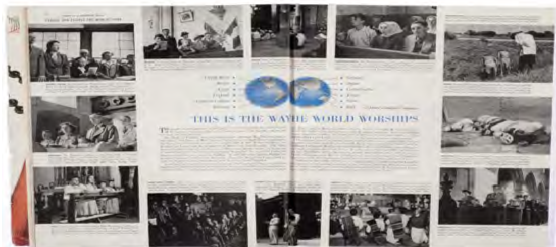
Imagem 7. Página dupla da revista Ladies' Home Journal , dezembro de 1948.