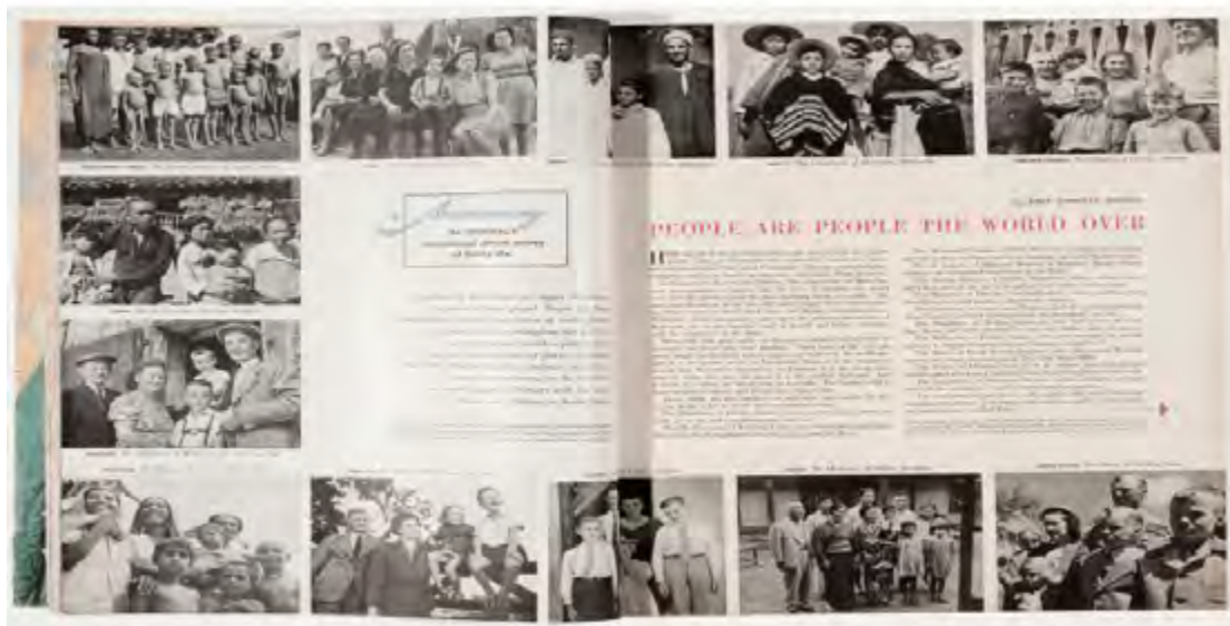
Imagem 5. Página dupla da revista Ladies' Home Journal , maio de 1948.

Na página seguinte, esta edição da revista já traz a primeira reportagem, dedicada à cozinha, sua estrutura e utensílios e, ao tratar destes assuntos, se foca nas mulheres e nas crianças. Seu título é “ O mundo da mulher gira em torno da cozinha ”. As doze fotografias mostram cada uma das mães das famílias, algumas com os filhos, em suas cozinhas, as quais têm as mais variadas conformações. Entre outras coisas, o texto da reportagem salienta a escassez de leite para as crianças paquistanesas, e a abundância para as inglesas; relata que a mãe alemã é visitada por pessoas famintas da cidade, e que continua a tradição iniciada durante a guerra de dar uma batata a cada um; afirma que cinco