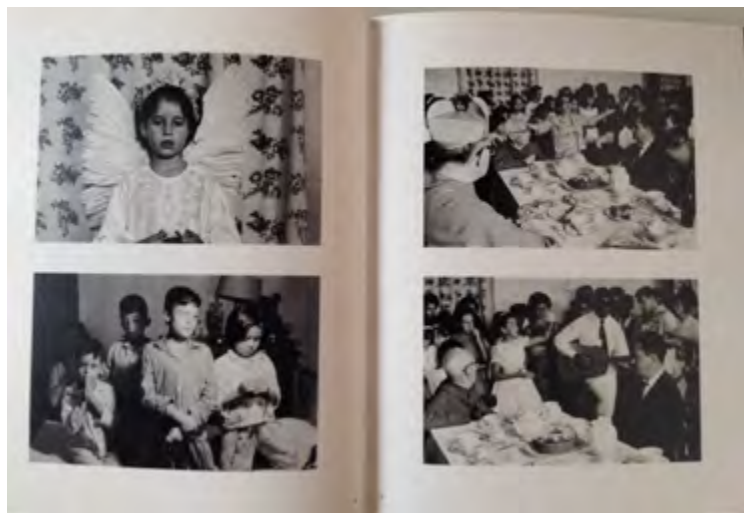
Imagem 4. Fotografias da série sobre a família mineira.

têm posses. A família é bastante numerosa, e o retrato de seus membros é feito em um pátio. A presença de crianças em grande número é também neste caso marcante. Andujar se demorou fotografando tanto as crianças da família, que aparecem jogando cartas, subindo em árvores, brincando, rezando e participando de uma primeira comunhão ( Imagem 4 ), quanto as que eram pacientes do pai da família no hospital.