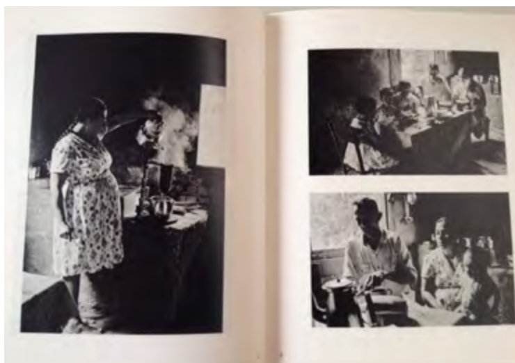
Imagem 3. Fotografias da série sobre a família caiçara.