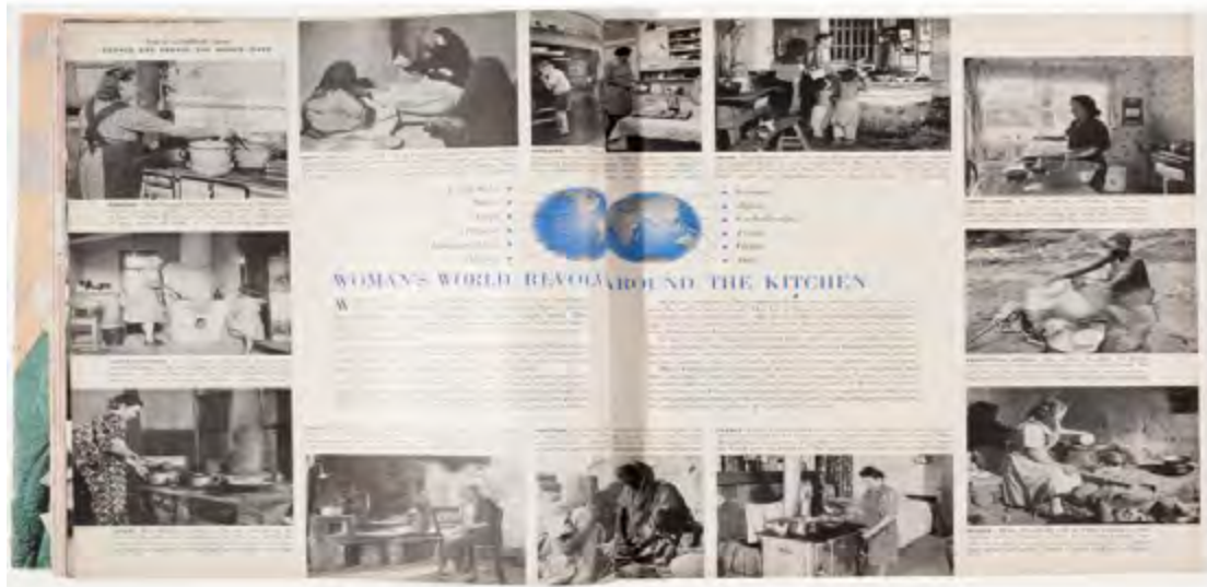
Imagem 6. Página dupla da revista Ladies' Home Journal , maio de 1948.

Uma a uma, em firme ordem de idade, as crianças do mundo são colocadas na cama para dormir. Há um momento de paz, uma hora para o homem e a esposa renovarem calmamente seu amor. A chama do anoitecer queima fraca, e logo apaga. Um hemisfério já está dormindo ( Ladies' Home Journal , v. LXVI, n. 4, abril de 1949).