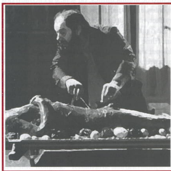
O cozinheiro, o ladrão, sua mulher e seu amante

segundo este autor, é um dos períodos mais violentos da história mundial. Na verdade, o que acontece é que nos tornamos muito sensíveis às brutalidades alheias. Temos leis, direitos, higiene, polícia, necessidades básicas para a maioria dos mortais, então exigimos mais para a nossa segurança. Ora, então, somos cúmplices dos discursos positivos universalizantes do ocidente. Desejamos o extermínio do mal. Baudrillard constata que há um paradoxo nos discursos positivos, pois se existe a necessidade da lembrança de um direito é que, de fato, ele não existe. Por que o direito da criança e o direito do trabalhador? As regras são criadas para quando, na prática, a ação está sendo violada. Ou seja, ainda existe o mal, mas não podemos celebra-lo livremente. Mas, com a maldade do O cozinheiro, o ladrão, sua mulher e seu amante , podemos vibrar, porque é ficção, é um alívio para nossas almas. É um breve momento sem restrições morais. Inventamos uma nova forma de transgressão, não há mais sacrifícios, mas há Greenaway, jogos violentos, cybersexo, blogs, orkut, etc.