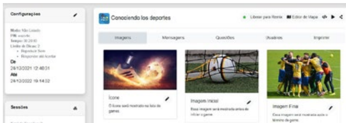
Figura 3 – Página das configurações do quiz do jogo