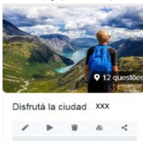
Figura 1 – Imagem inicial do jogo publicado na plataforma Escape Factory