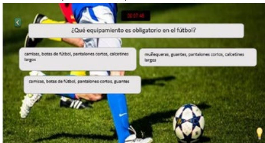
Figura 5 – Quiz do jogo Conociendo los deportes