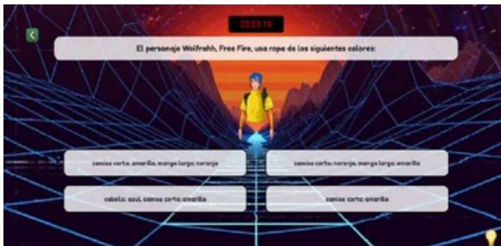
Figura 4 – Quiz do jogo El mundo de los juegos