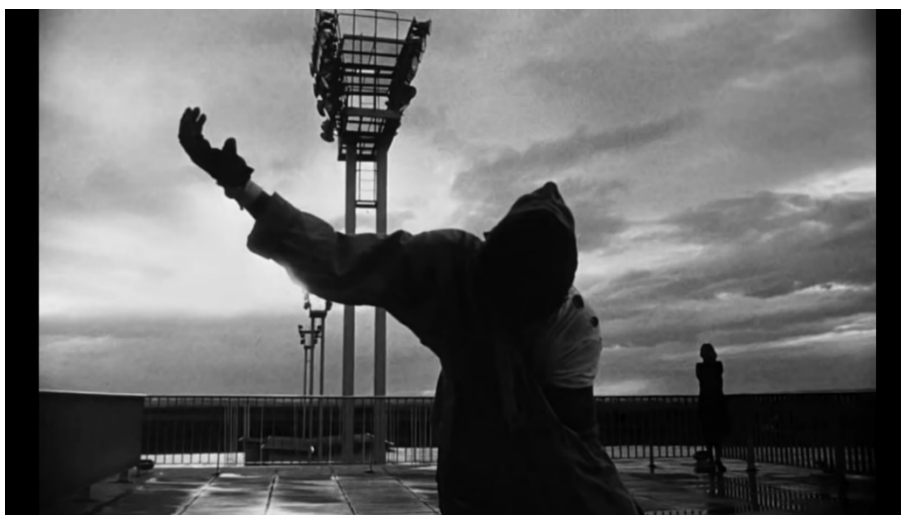
Figura 6 – Cena final de La Jetée