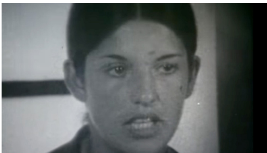
Figura 4 – Fotograma de On Vous Parle Du Brésil: Tortures