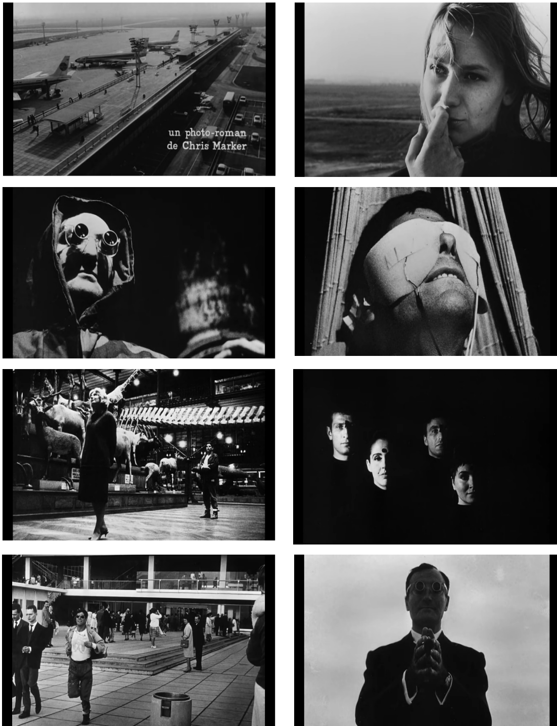
Figura 2 – Fotogramas de La Jetée