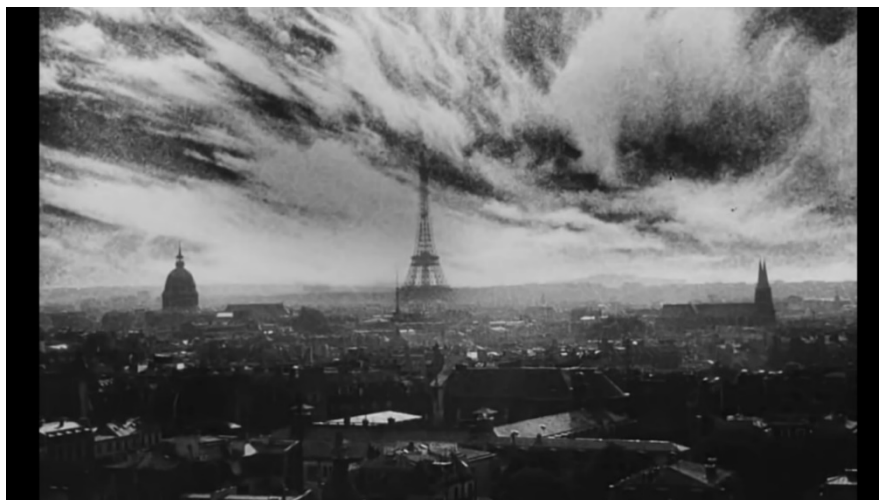
Figura 1 – Paris pós-terceira guerra mundial em La Jetée