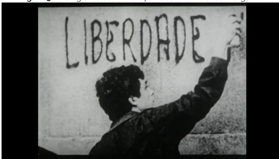
Figura 5 – Fotograma de On vous parle du Brésil: Carlos Marighella