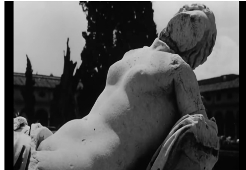
Fonte: Captura de tela do filme La Jetée (1962) realizada pelo autor.

Esta análise, no entanto, não se concentra apenas no problema da conservação de imagens em La Jetée , mas manifesta também o interesse na produção de poesia entre os presos políticos 4 da ditadura militar brasileira como gesto que põe em evidência os percursos da memória individual e coletiva. Se os documentos oficiais encobrem a memória do passado autoritário brasileiro, a busca pelos rastros é inevitavelmente direcionada às vítimas, uma vez que o testemunho se torna peça-chave para contar a história silenciada/excluída. A escrita, como meio de conservação da memória, pode se tornar uma alternativa para a operacionalização desse testemunho, garantindo a determinados textos um teor testemunhal (SELIGMANN-SILVA, 2003a, p. 47), seja no sentido de testis (testemunho de um terceiro), seja no de superstes (testemunho de um sobrevivente) (SELIGMANN-SILVA, 2003b, p. 373-374).