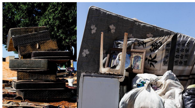
Figura 1.

Descartáveis como os objetos que transportam, esses homens e mulheres insistem em existir e talvez sua parafernália esteja aí para nos dizer exatamente isso: “nós ocupamos, sim, um lugar no mundo, e o marcaremos com nossos restos”. Lembro aqui de um conjunto de imagens de Janine Moraes, repórter fotográfica de Brasília, produzidas quando ela acompanhou a violenta retirada de dezenas de famílias sem teto de um acampamento em Planaltina, na periferia da capital, em 2016. Após o cassetete, o trator, o corre-corre, as paredes sendo levadas ao chão, as pessoas voltam para recuperar seus objetos, que, empilhados ao relento, dão a dimensão do desconsolo de suas existências. São colchões sujos, geladeiras arranhadas, plantinhas meio mortas em potes de margarina, espelhos partidos, brinquedos, livros rasgados 5 . Com um mínimo de empatia, quase nos vemos ali, juntando os pedaços com eles, entre os escombros.