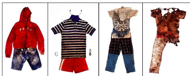
Figura 2. Fotos de Fred Ramos.

Essa “ausência comentada” – não dos objetos, mas das pessoas às quais eles remetem – se manifesta visualmente na série de fotografias do salvadorenho Fred Ramos sobre crianças e jovens assassinados em diferentes países da América Latina. Suas fotos apresentam apenas roupas e pequenos objetos que eles portavam quando foram mortos, e que são preservados pela polícia forense para uma possível identificação pelos familiares. O que mais choca nas imagens é justamente a ausência dos corpos – franzinos, pequenos –, subtraídos pela violência 10 . Quase dá para ver nossos filhos preenchendo um moletom vermelho, ou grudados naqueles fones de ouvido imprestáveis, mas as manchas de sangue e de fogo, os rasgões e as perfurações logo impedem que continuemos qualquer aproximação. E temos de voltar a imaginar a criança que realmente viveu ali, sua história e a daqueles que a perderam.