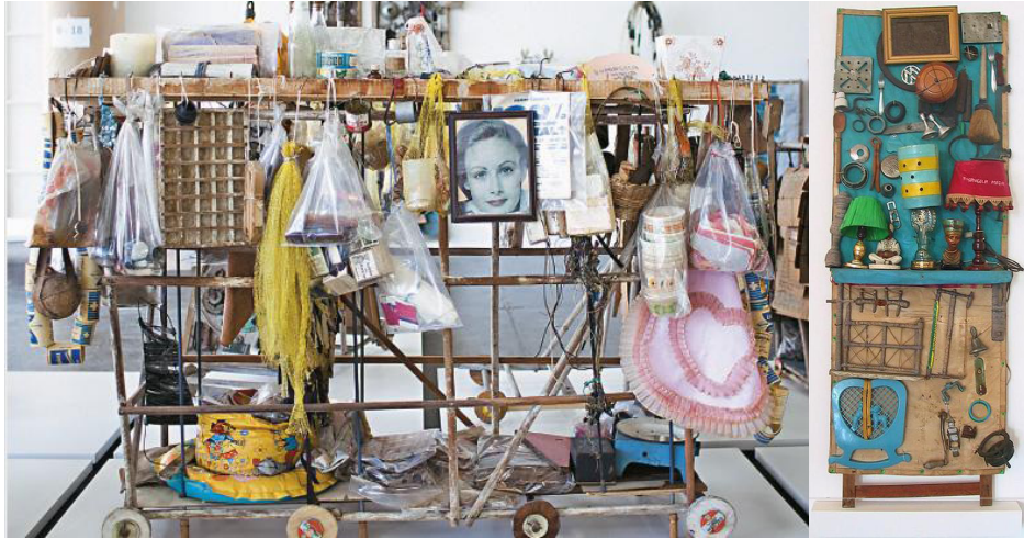
Figura 4. Assemblages de Arthur Bispo do Rosário.

lugares; ou para definir a subjetividade de protagonistas e narradores, inscrevendo-os na vida e delimitando-os nas hierarquias sociais. Falam de poder e de desigualdades, da miséria e do mais completo abandono. Refletem, ainda, em sua superfície muitas vezes desbotada e com fissuras, a memória daquilo que já não tem substância no mundo – confirmando, de algum modo, nossa existência e a daqueles que amamos.