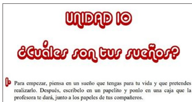
Figura 2. Atividade de pré-leitura da unidade 10 do material apresentado em Pinho (2015b).

Todas as unidades iniciam com uma atividade de pré-leitura, ou seja, uma atividade que introduz a leitura que será realizada, que prepara os alunos para o que será abordado e que também auxilia na recuperação de conhecimentos prévios sobre o tema ou o gênero discursivo proposto. As atividades de pré-leitura presentes no material são questões introdutórias que servem para nortear discussões iniciais, pequenos textos que contêm as informações que serão trabalhadas na unidade, algum tópico gramatical específico, como o uso do verbo “llevar” para referir-se ao que se está vestindo, ou alguma imagem que remeta ao tema proposto. A unidade 10, por exemplo, que tem como temática os sonhos, os desejos para o futuro, tem a seguinte atividade de pré-leitura ( Figura 2 ):