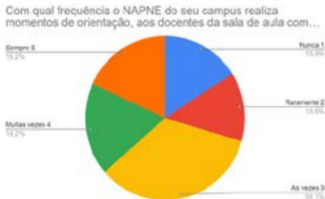
Gráfico 1 – Frequência com a qual o NAPNE realiza momentos de orientação ao docente da sala de aula comum