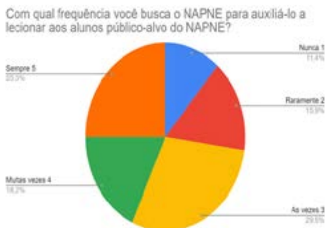
Gráfico 3 – Frequência com a qual os docentes buscam apoio no NAPNE para auxiliar a lecionar aos alunos com deficiência

Quando perguntados sobre a busca por auxílio para confeccionar o PEI, os docentes recorrem ao NAPNE (85,7%), setor pedagógico (64,3%), livros e artigos da área (21,4%) e não buscam ninguém (3,6%). Vale ressaltar, também, que a maioria dos docentes disse buscar o NAPNE com frequência intermediária e sempre, em uma escala de 1 a 5, em que "1" é "raramente" e "5" é "sempre", para auxiliá-lo a lecionar aos alunos, conforme Gráfico 3.