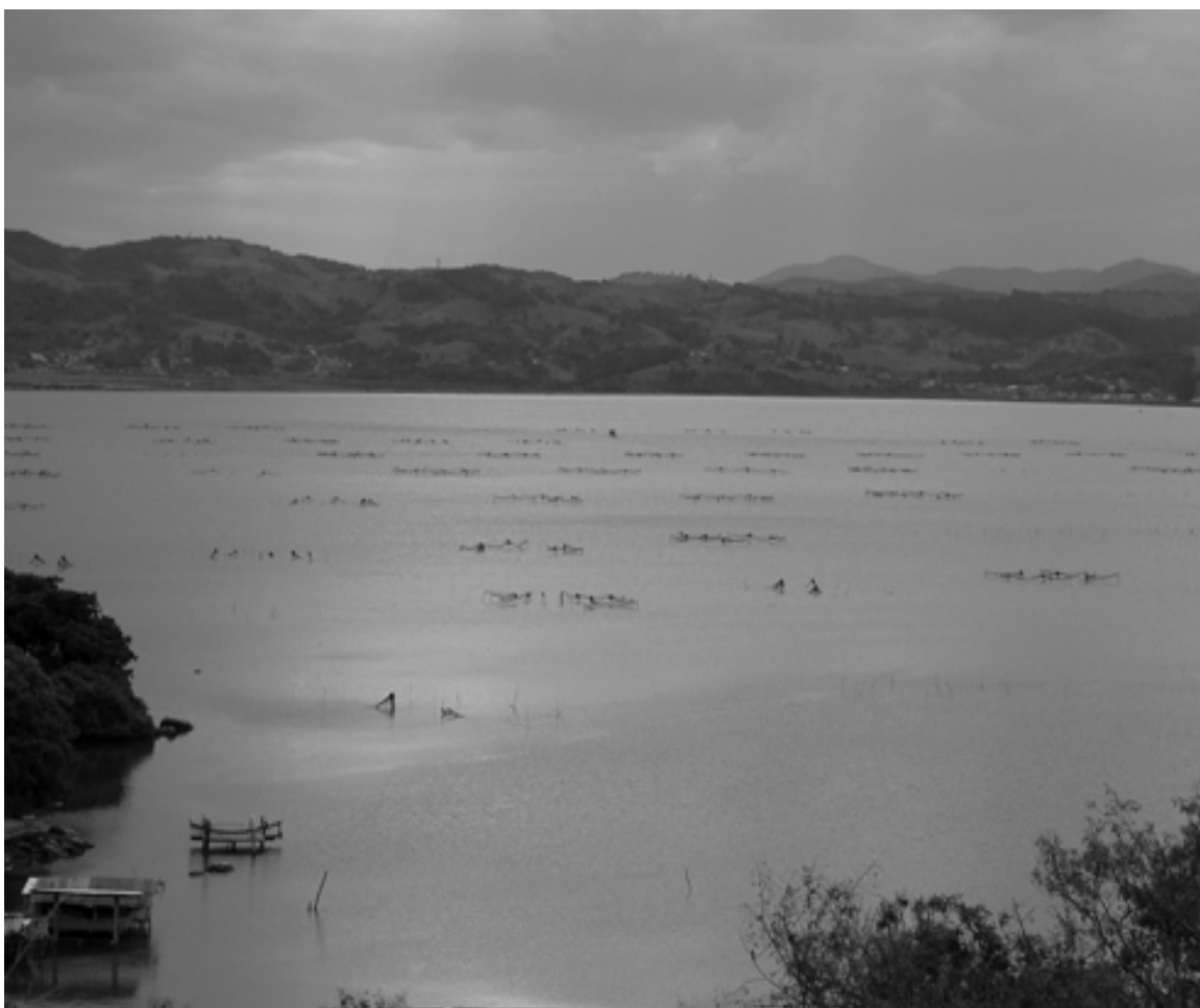
Figura 1. Redes do tipo aviãozinho no Sistema Estuarino de Laguna, SC.