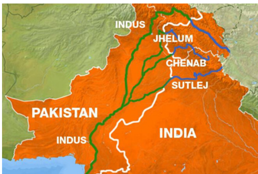
Figura 2. Rio Indo após a partição.

Além disso, por possuir regiões montanhosas e ser próxima de três potências nucleares, a Caxemira é um ponto crucial de projeção do poder e da segurança na região. O território abriga também a nascente do rio Indo e seus afluentes (figura 2), fundamentais para a agricultura de ambos os países. Portanto, qualquer alteração significativa no conflito deve levar isso em conta.